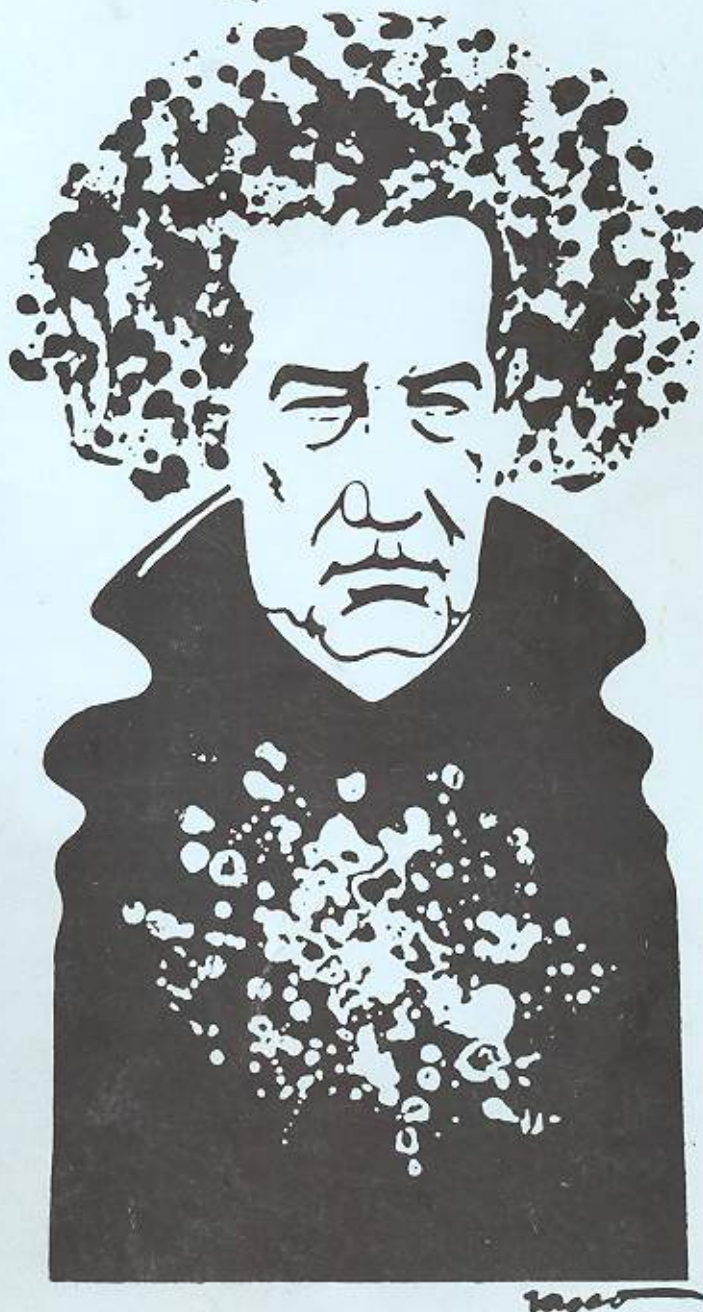
Octavio Paz 1914-1998