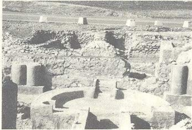
له پتسهوه ژووری کنگی که دهکه‌ویته به‌ردهمی ژووری «بیم» شانوی طقوس

له قسل و بهرد دروستکراوه، ئەم شووره‌یه پاشماوه‌که‌ی دهکه‌ویته شانوی راستی دهره‌بنده‌که و به‌سه‌ر جاده‌ی سلیمانی - که‌رکووکدا دهره‌وانتیت، ئەو به‌شە‌ی که له شووره‌که دیار و دهرکه‌وتوو به‌ سە‌ردهمی عە‌بدولرحمان پاشای میری بایان ده‌که‌رتتوه.