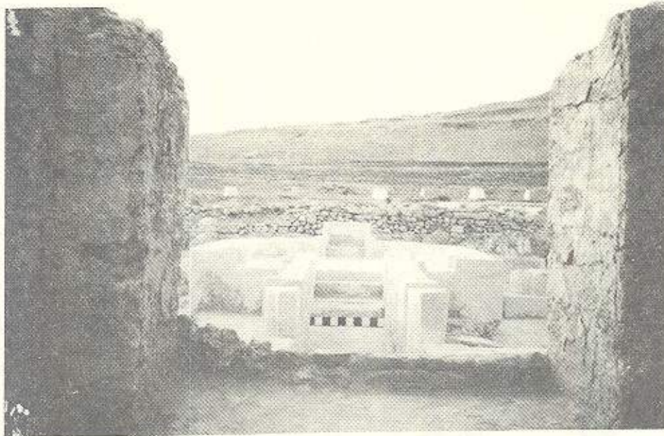
ده‌روازه‌ی کلێساکه به‌ره‌و ژوو‌رو رێپه‌وی بیری ناو دێره‌که

ده‌دات، له‌گه‌ڵ بوونی دیواریکی ئه‌ستوور به پانایی ۲.۵ تا ۳.۵ میتر، له‌گه‌ڵ قولله‌یه‌کی به‌رگری (برج الدفاع) له هه‌ر گۆشه‌یه‌ک و، قولله‌یه‌کی ناوه‌ندی له هه‌ر یه‌کتێک له چوار لاکانیدا.