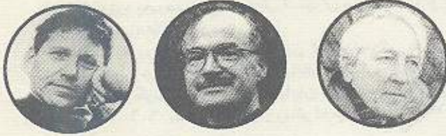
توماس ترانسترومر کنوت تۆدیگۆرد ناموس نۆز

ههشت بۆ مهسهلهی کورد و تورکیا و بازرگانی لهگهڵ تورکیا تهرخان کرابوو، ئەم چالاکییه له سێ بهش پێک هاتبوو: