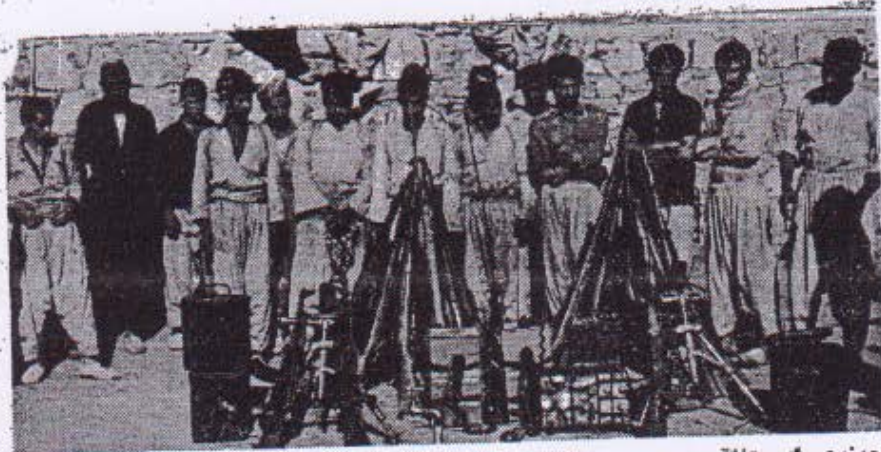
ههندی له و تفاق جهنگی یانهی له چریکه کانی ناوچهی نهوولی گیران له گهل چریکه دیله کانا ( پیشکوهه به و ساویلکانهی تا نیستا له و هیوایه دان که مهلا کوردایه تی لولا )

له ۱۸۶۵ م دا فریدریک لنگز له لېنن مرد . لنگز له دوای کارل مارکس حازری ( که له سالن ۱۸۸۲ دا مرد ) ، گه وره تر یس زانو پروردده گری پرولیتاریای سهرده می خوی بو ، له سرانسری جهانی پیشکوهو دا . وه لنگز کانه وه که سره نجام کارل مارکس فریدریک لنگز کورده وه ، کاری نعم دوو هاوره به بووه کاریکسی ناوکویر . . وه بولوه دی بیگمین فریدریک لنگز چی کرده له پیشاوی پرولیتاریادا ، پیوسته له روونی له و پوره تی بگمین بکنه بووه رو چالای جاکس بری هه شتوه له پیش خشی جـوولانه وی کریکراتی له سرده ده دا . مارکس وله لنگز به کم کسی بوون دهریان خست که چینی کریکز به ناچاری ، له گهل داواکانیا له دایک لهیت ، له زیر رژیمی نابوری نیستادا ، له گهل چینی بورجوازیدا ، بی گومیان پرولیتاریا هرووست نه کات تی بگمینی له خات . ههروه ها دهریان خست که له وه هولد نه تولا . جوامرانه بهی که سانیکی به خشنده بی هه له شتی ده گزی نادمزاد بزگاز ناکات له و کوزروه وی یانهی که نیستا نهنگی بی ههل چنیده ، به لکو له و خه باسه چینایه می بهی پرولیتاریای ریکسراو نهیکات نادمزاد بزگاز نه کات . مارکس . وله لنگز به کم . کسی بوون له نویسنه . زانسی به کانیاندا چه سپاندیان . که سوشالیزم شیوه به نه له خه یالی کسانیکی خه والو نی به ، به لکو دوا تامانچو . سره نجامسری پیوستی پیشکوهونی هینسره به ره هم هینسره کاتی ناوکوملی نعم سهرده می به . جموو له و میزووه ی نا نیستا . پورسراوه وه میزووی خه پانی چینه کبان بووه ، وه زال بوون سرکوهنی چنه چینی کومه لایه نی