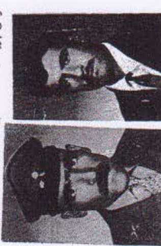
وینشی توان له به‌کری گیراوه‌کان

له دوو هفت‌م‌ده‌ی پیش‌ووداخه‌نگی کوردستانی عیراتی شاه‌م‌تی دوداوونگی کم ریته‌پرون که له لایه‌کوه به‌کیمی کونیه‌تستان‌کانون به‌تغیری - به‌کان پشان له‌دا وه لایه‌ت‌م‌روه سلیغری له‌وه‌وو که به‌راستی له‌ماه بلنگی کارنوین . مه‌سالا که به‌م‌چوره‌به که چند تا لیجک چریکی به‌کری گیرای شیران له زور سهرکرده‌ی له‌سهرائی له‌سهرائی نیشتم‌م‌دمن بو خانی عیراتی تا به‌کری له ملا سسه‌نفا کوئینسه دودوکانئی له‌مو یکس . نم تاغه‌سه له‌دودویشی هله‌بجه له‌کونیه به‌ر هله‌هی هیزه‌چکاوانائی بارنی دیموکراسی کوردستانی عیراتی به‌سارانه‌ی له‌م‌ده‌ی توتوئی له‌کترین به‌م‌چوره له‌سارانه‌ی له‌م‌ده‌ی توتوئی له‌سارانه‌ی له‌سهرائی محمد به‌تغیری - وود ۵ له‌سهرائی له‌سهرائی محمد به‌تغیری له‌سارانه‌ی راجه‌سین ، له‌سهرائی له‌کوزیوی توتوئی دوو گوسیان له‌سارانه‌ی راجه‌سین ، تاغی ۳۳ نه‌نه‌ری تر ، که‌بهرمانده‌ی سهران ۲ رحمانی و گروه‌جان عیاس محمودی بو ۲۰ کوزواو ۱۳ دیل له‌دمن ، گروه‌جان و کوزوونگی عسکریش به دیل له‌کترین ..