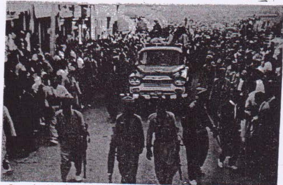
ئەو چریکەتەیی گەورە پێشەڕگەیی کوردستانێ داییشانی کومەلانی خەڵکی دران • پێشکەشی بە تاخمە بە حەرقیەکی بە هادین کە تا ئیستا جولانەووە چە کردارە بە کرێگراوەکی مەلا بارزانی بە شورش دانەنین (

(5) (6) حکومەتی شای نوکیەری سەنتو بە جویریکی شێتانی هەول ئەدات بوو لێبانی سەر بە خویی وولاتە - گەمان ئەوەتە دەستی کردووە بە زنجیرە بەک بۆ کوردنەووی بەیان نامەیی ژەھواری دەمی بە ناوی ( بەرەیی نیشتمانی ) یان ( قەومیەتە بەرەبەکان ) یان بەتاوی ( اسلامیتەو ) بوو تەشەردانی کومەلانی خەڵکی عراق وە ئە لایەکی ترەووە بە هەموو توانایەووە هەولی تازە کردنەووی شەڕ ئەدات لە کوردستانا بو ئەم مەبەستەش بە هەزاران جاشی کوکر دوتەووە ( چریک ) وە دابەشی کردون لە سەر سنۆرە کاتی وولاتە کە مان بە تازەترین چە کەووە وە بە جلی پێش سەر گایەتیەووە .. وە گەلیک ئەو چریکەتە کە سنۆر گراون بەم دیوا توایە