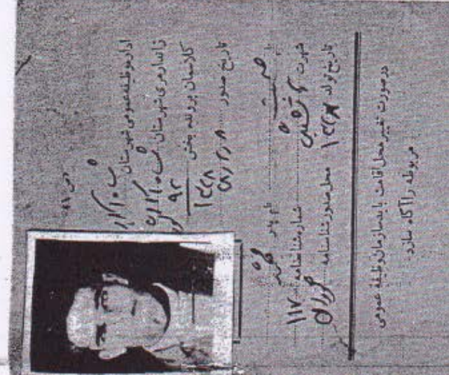
کونیه‌تستان پانگی کونیه‌تستان شماره تاریخ رسید رانک ماهی مدل شماره ۱۳۴۸ تاریخ شرکت در فرقه کشی

مدنی کس خویان چه‌کدار کردوه له زور سهرکرده‌ی ملا سسه‌فا ( یعنی له‌سارانه‌ی شلاو نیشتم‌م‌دمن ) دان . سهرکرده‌ی نیشتم‌م‌دمن لوده‌ی نیشتم‌م‌دمن هله‌بجه له‌سارانه‌ی نیشتم‌م‌دمن له خویان له مه‌سارانی خبا‌بیا رایش کردوه له‌لا یمن مارگیسه لیشتم‌م‌دمن - به‌کام‌وه دهم‌کران بو خور له‌سارانه‌ی له پشت رادیوی به‌کری نیشتم‌م‌دمن به‌کری له‌سارانه‌ی له‌کونیه ده‌هات له کاترکا که ملا سسه‌فا خویان به‌کونیه یا نه‌ی له‌کلی نیشتم‌م‌دمن به‌کری له‌سارانه‌ی نیشتم‌م‌دمن له‌سهرکرده‌ی نیشتم‌م‌دمن و نیشتم‌م‌دمن له خویان رادیمائی له‌خبا‌بیا کرن دل‌لی استعمار له‌کونیه ۱۳ دوست‌م‌دمن سسه‌فا له‌کلی نیشتم‌م‌دمن و نیشتم‌م‌دمن له‌سارانه‌ی نیشتم‌م‌دمن نیشتم‌م‌دمن له‌سارانه‌ی نیشتم‌م‌دمن و نیشتم‌م‌دمن له‌سارانه‌ی نیشتم‌م‌دمن له‌سارانه‌ی نیشتم‌م‌دمن و نیشتم‌م‌دمن له‌سارانه‌ی نیشتم‌م‌دمن له‌سارانه‌ی نیشتم‌م‌دمن و نیشتم‌م‌دمن له‌سارانه‌ی نیشتم‌م‌دمن