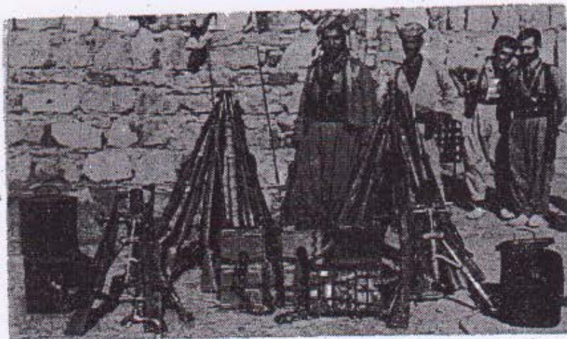
ههندی له و دستکوه تانهی له چریکه کان تیروان لسته ناوچهی نهوولی ( پیشکوهه به و چه کدارانهی تا نیستا لای مهلاویه کانی ناونه ته وه هه لیکه له تیراون و ههستی نه ته وایه تیان استغلال کراوه )

نه هه رانه وه که له نه مریکا مه شتی تایه تی دا دراون له سر جهنگی تایه تی . . وه له کوتایی دا به یانه که باسی له و دوره نه کات که جی به جی کردنی سپیرداروه به مهلا چومی له نه خشی نیمپریالیسته کانا .