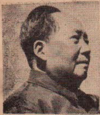
وهر گیرانی : بهریفانی

بکهنهوهو بهو هو بهوه ره خنه مان لی بگرن ، چونکه نیمه خزمه تی گهل نه کهن . له بهر نه وه ههموو مروئیک - هر که سیک هه به - نه توانیت به ناگامان بییت له کهم و کووری به کانمان . نه گهر خاوهن ره خنه پیکای له ره خنه که یا نه وا کهم و کووری به کانمان راست نه کهینه وه ، وه نه گهر پیشنیازیکی کرد که سوودی گه لی تیا بی کاری