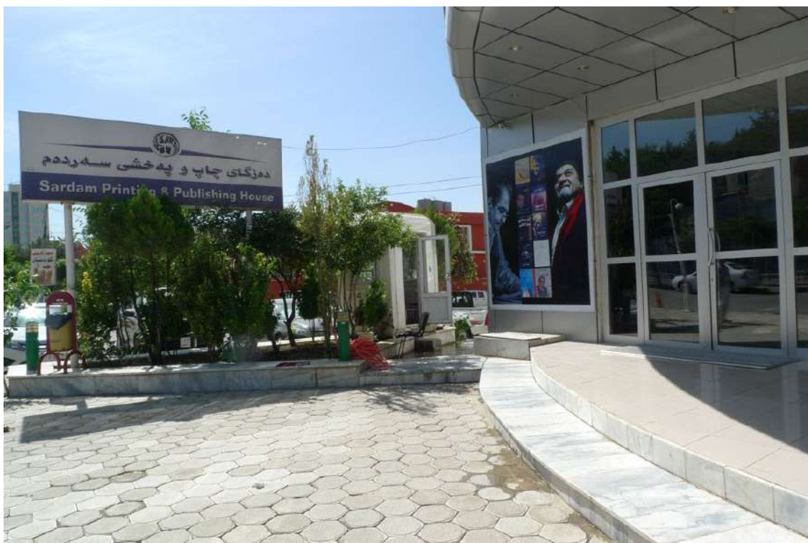
Fot. 19. Przed budynkiem Instytutu Serdem/Sulejmanija