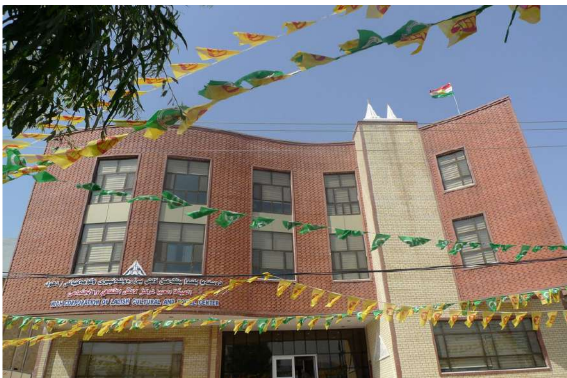
Fot. 13. Budynek Centrum Laleş/Duhok

trzy lub raz na osiem miesięcy, zaś gazeta jest tygodnikiem. Realizujemy zadania związane z jezydzką historią i folklorem. Mamy też 8 oddziałów w mniejszych miejscowościach zamieszkałych przez jezydów (takich jak np. Şemal, Şengal, Be‘şiq û Behzan, Ba’dre), a także w Niemczech. W tych miejscowościach działają związane z naszym Centrum szkoły jezydzkie. Lekcje odbywają się po kurdyjsku i dotyczą naszej religii, zwłaszcza starych tekstów.