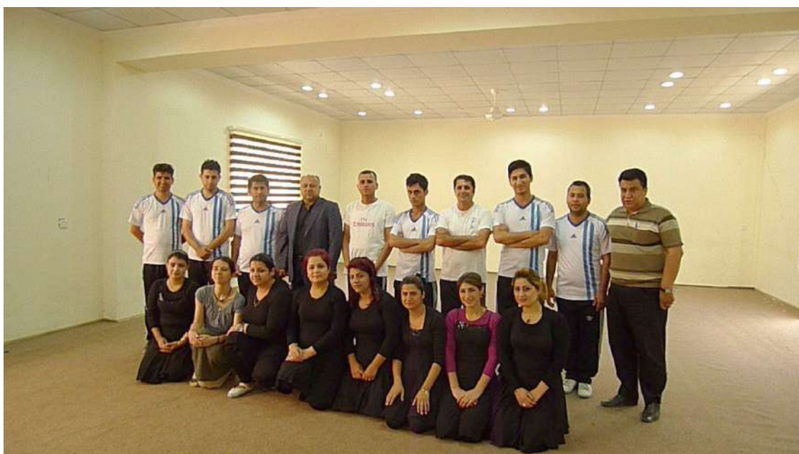
Fot. 5. Zespół taneczny podczas próby w siedzibie Dyrekcji ds. Folkloru i Tożsamości/Hawlêr

Dział strojów natomiast zajmuje się kolekcjonowaniem strojów kurdyjskich ze wszystkich części Kurdystanu (północy, wschodu, zachodu i południa). Często są one bardzo stare, więc poddajemy je konserwacji, opisujemy, katalogujemy i eksponujemy na wystawach. Zależy nam, aby przyszłe pokolenia wiedziały o istnieniu takiej tradycji.