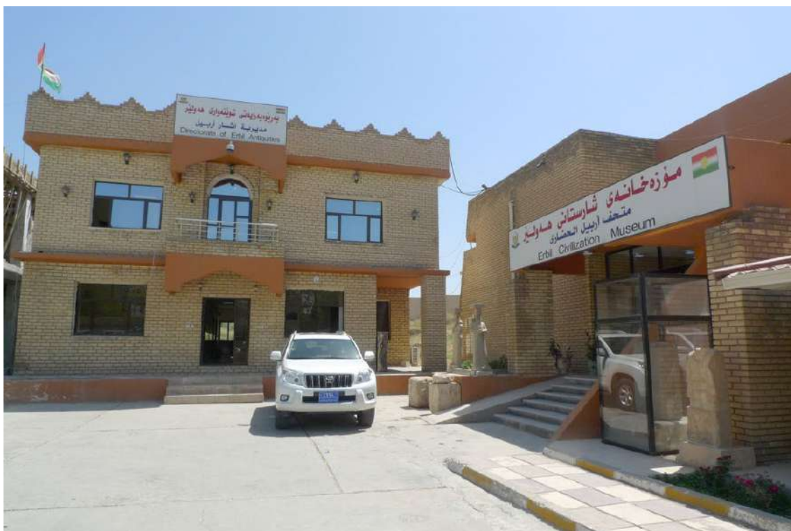
Fot. 8. Budynek Dyrekcji ds. Starożytności, po prawej stronie widoczne Muzeum Starożytności

Dyrekcja ds. Starożytności składa się z kilku oddziałów. Pierwszym i jednym z najważniejszych jest Wydział Badań. Składa się z kilku mniejszych pododdziałów, a główną jego funkcją jest badanie pod kątem starożytnych zabytków terenów pod budowę lub tych miejsc, gdzie realizowane są jakieś nowe projekty. Współpracujący z nim Wydział Prawny wydaje oświadczenia wstrzymujące prace budowlane w przypadku, gdy zostaną znalezione jakieś stare fragmenty murów, przedmioty lub biżuteria. Wydaje również zaświadczenia pozwalające na kontynuowanie prac. Natomiast jeśli coś zostanie odkryte podczas budowy, a nasza dyrekcja nie zostanie o tym poinformowana, wnosimy sprawę do sądu. Wydział prawny zajmu-