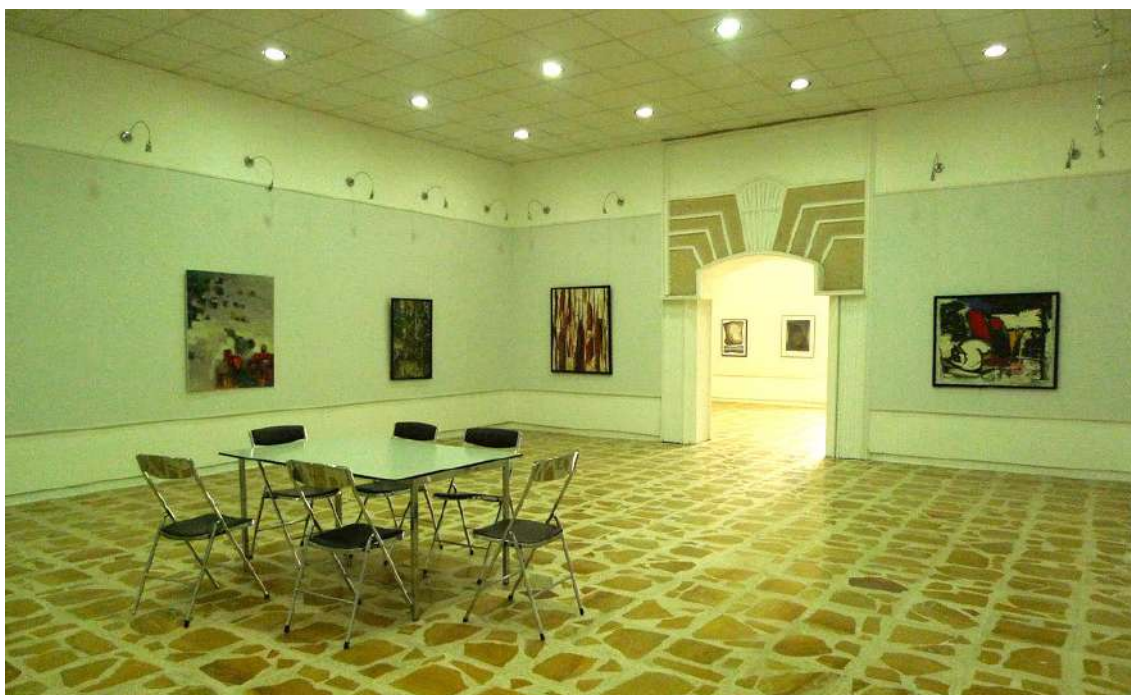
Fot. 18. Galeria Duhok

Rocznie przygotowujemy w tym miejscu dwie wystawy, ale w Duhoku są też inne galerie, które działają aktywniej, realizując np. dziesięć wystaw. Zależy nam jednak na wysokiej jakości przygotowywanych ekspozycji. Z reguły wystawy nie mają specjalnych tytułów, prezentują różne prace artystów kurdyjskich. Za ich dobór zwykle odpowiadam ja. Nie pozwalamy sobie na tworzenie rozbudowanego programu wystaw, bo potem często okazuje się, że nie mamy pieniędzy na jego realizację. Rozpowszechnianie informacji o wystawach odbywa się za pomocą afiszy i internetu (Facebook). Każda wystawa rozpoczyna się wernisażem, a materiały i informacje o niej archiwizujemy.