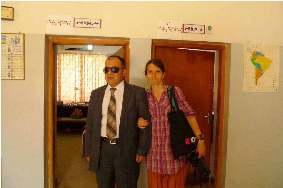
Fot. 11. Z prezesem Centrum Roşna