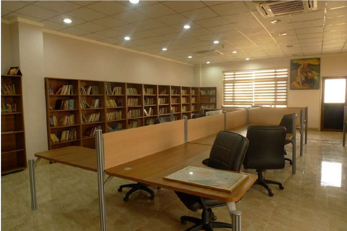
Fot. 14. Biblioteka