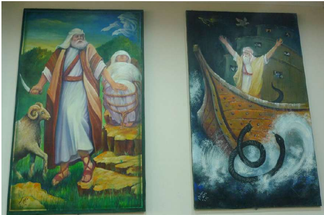
Fot. 16. Obrazy przedstawiające proroka Ibrahima (Abrahama) na chwilę przed ofiarowaniem syna (po lewej) i scenę potopu. Widoczny czarny wąż, który według jezydów zatkał dziurę w arce i uratował ją od zatonięcia.

Dziś zależy nam, żeby dostarczyć rzetelną wiedzę. Organizujemy także seminaria dotyczące jezydzkiej historii i religii. Uważamy się za organizację społeczną i kulturalną, a nie polityczną. Działamy według planu przygotowywanego na początku roku. Plan ten przygotowuje zarząd centrum. Wydaliśmy również książeczkę prezentującą historię centrum i jego działalność. Co roku, zazwyczaj w lipcu, organizujemy festiwal kultury jezydzkiej. Informacja o naszych działaniach jest rozpowszechniana za pośrednictwem naszych oddziałów i zaproszeń wysyłanych bezpośrednio do przedstawicieli społeczności jezydzkiej na całym świecie.