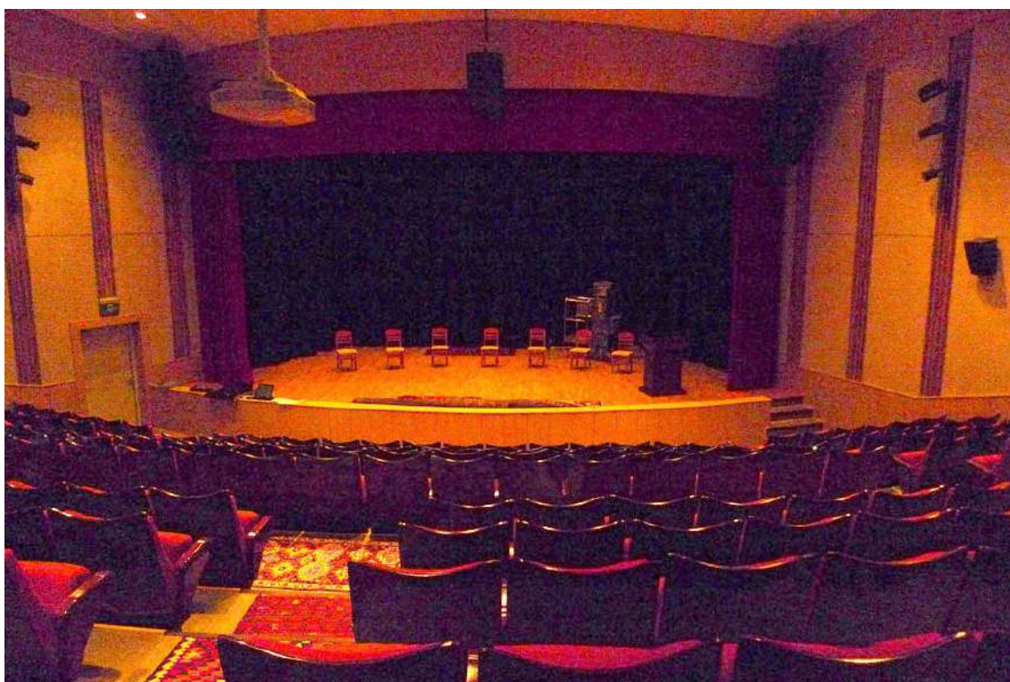
Fot. 23. Sala koncertowa Instytutu

poźniej wysłano je nawet do Watykanu. Zrobiliśmy też film dokumentalny na temat tej kobiety przedstawiający asyryjskie obyczaje, życie codzienne, praktyki religijne (kościół, z którym była związana w Mosulu, został wysadzony w powietrze). To jeden z lepszych przykładów tego, jak można pokazać kulturę jakiejś grupy (powstała również wersja angielska tego filmu). Zależy nam również, by pokazać, że Kurdowie są tolerancyjni wobec innych mieszkańców tych ziem i ich kultury. Nasz los był przecież ten sam, dlatego staramy się bardzo otwierać na kulturę mniejszości. Wydaliśmy dwie książki o jezydach, pięć publikacji o Kaka'i (Ahl-e Haqq) 47 w Yorasanie. Były to obszerne książki przedstawiające teksty religijne i obyczaje. Ta działalność jest dla nas bardzo ważna.