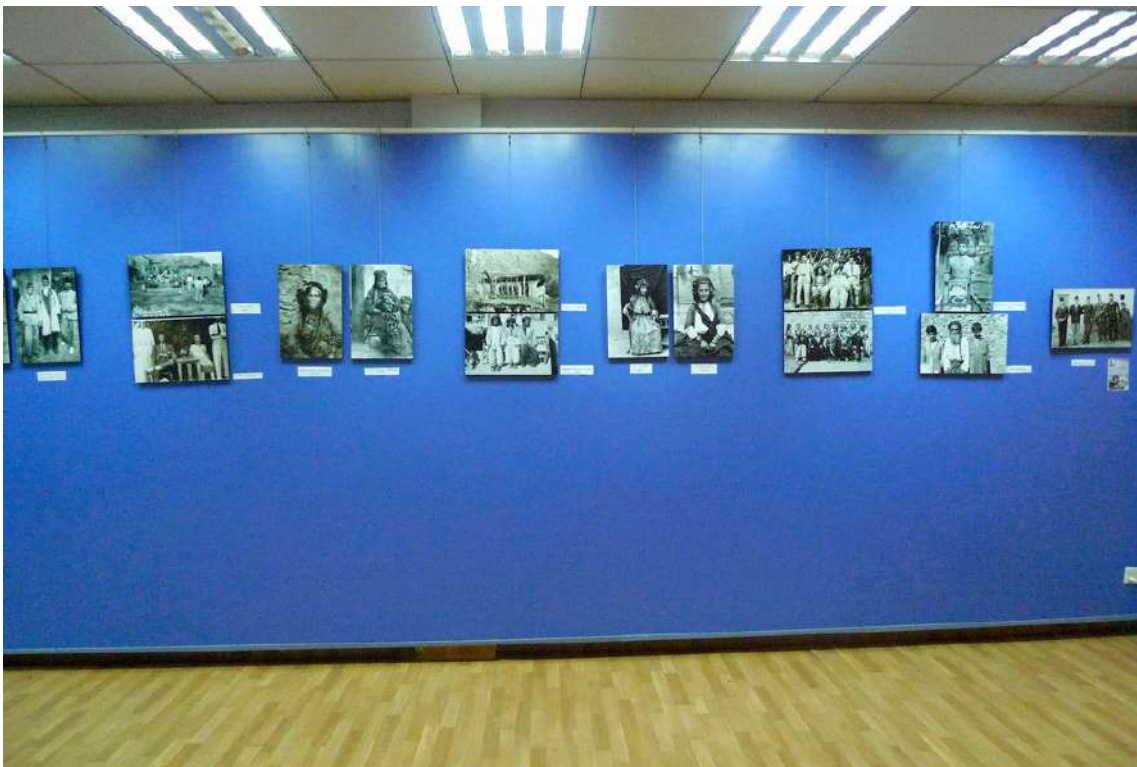
Fot. 4. Wystawa poświęcona historii kurdyjskiego dziennikarstwa, Galeria Dyrekcji ds. Kultury/Hawlêr