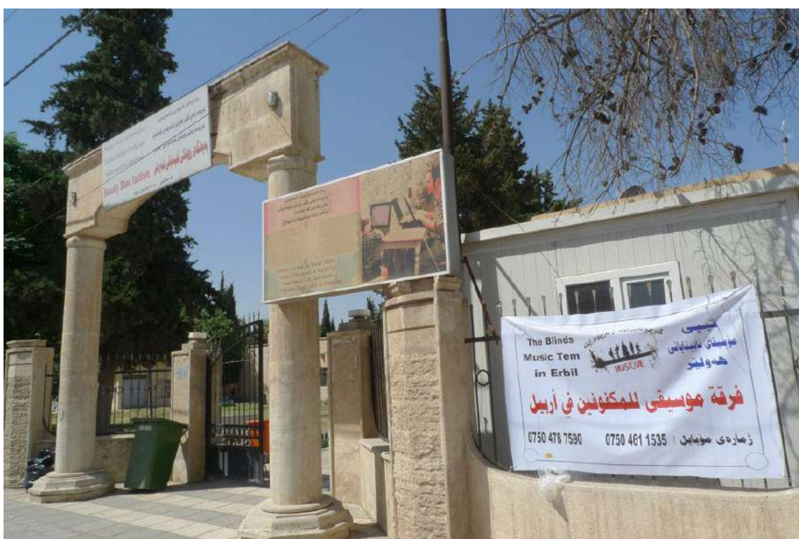
Fot. 10. Centrum Roşna