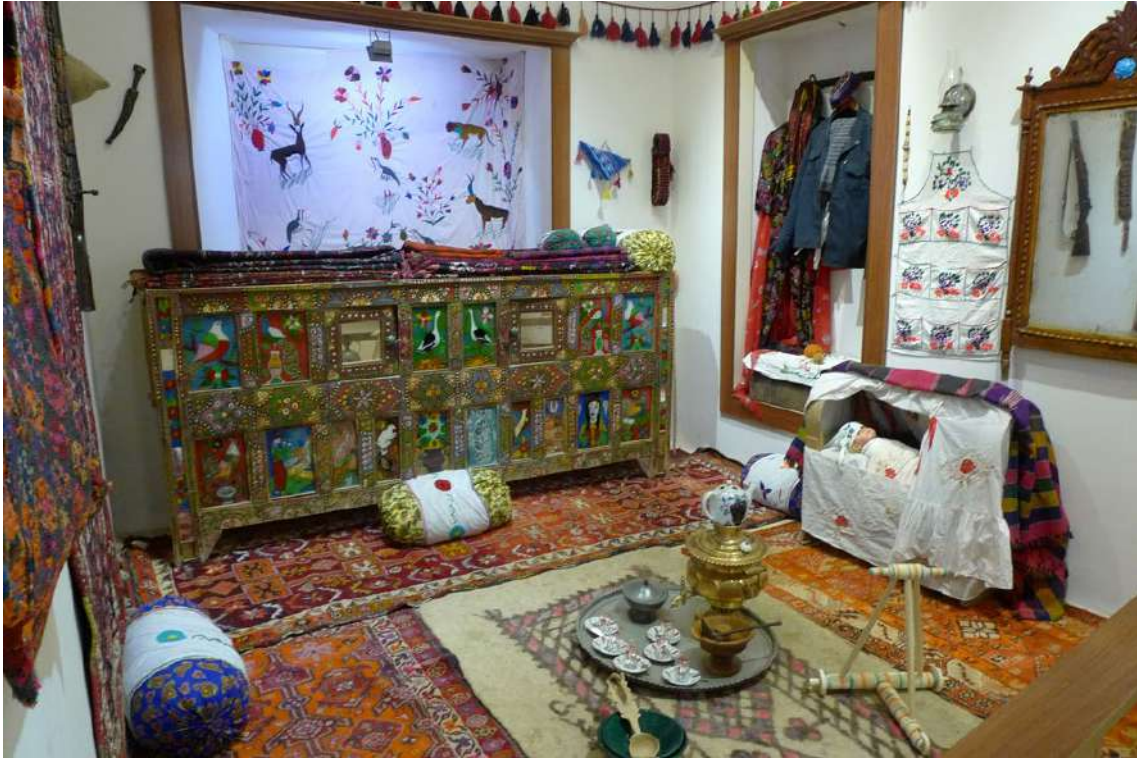
Fot. 3. Muzeum Qelat