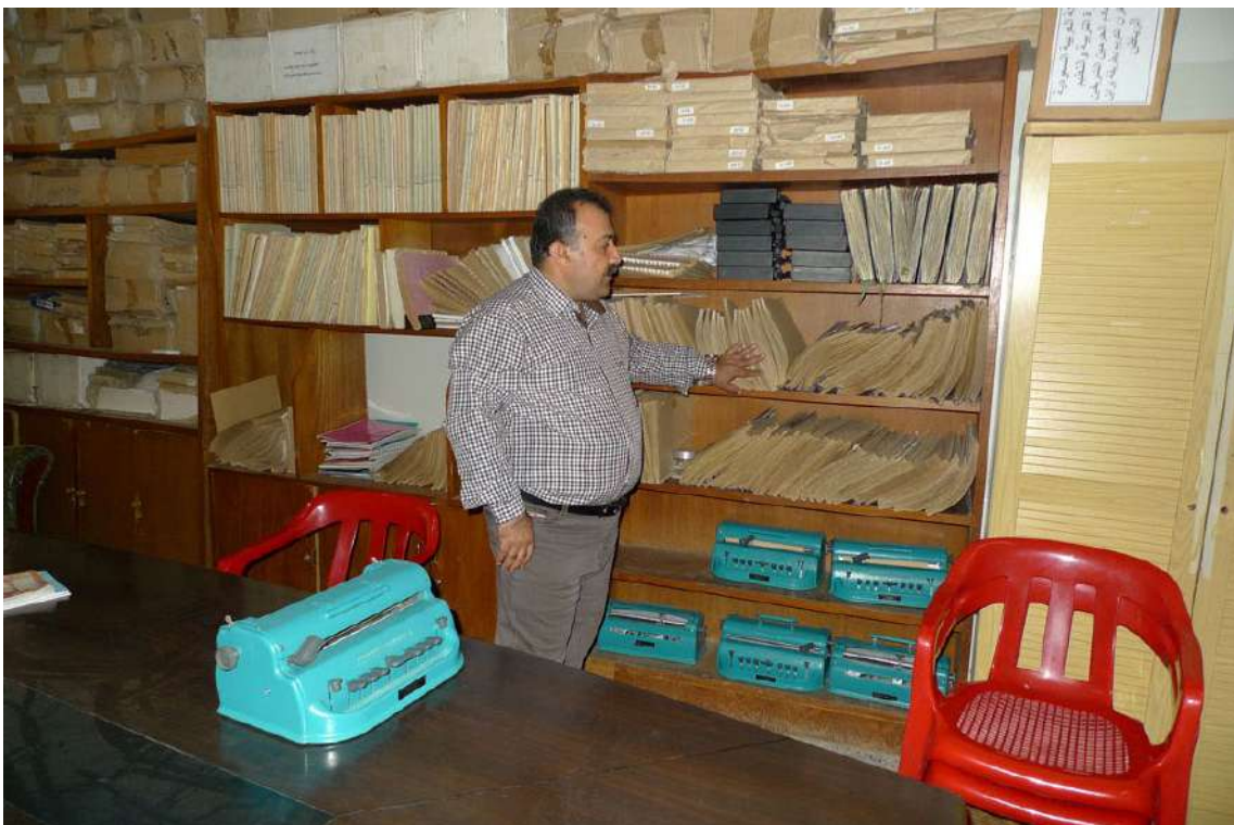
Fot. 12. Biblioteka Centrum Roşna