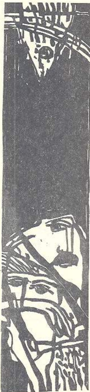
恋人漁之集——21x44cm Lovers and a Fish