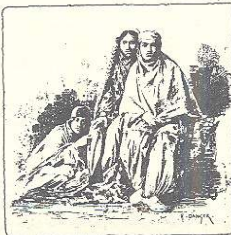
FEMMES DE LOURISTAN.

هه‌ننه‌هه‌ندی ئه‌ره‌سی. هه‌. داڤۆی سالی ۱۸۸۷ لای هه‌تیری بێنه‌تر پۆرۆکی ئه‌ره‌سی جێزه‌ کوردستان دێنه‌ی هه‌ی لوره‌ستان و ژێه‌ کوردی کوشاده شهم دهر و ئینه راسته‌وتنه‌ به‌وه‌ ژێه‌ کورده کۆی کتێبه‌یه‌ ناو بانه‌ کۆی مام ئه‌وه‌ هه سه‌ره‌وه‌ (له‌ کوردستان) به‌هه‌رێزه‌ تا باوه خارس- (نومه‌ر کراوه‌ هه‌ر ده‌سه‌ مان لاله‌ی یه‌ یا کراوه‌.