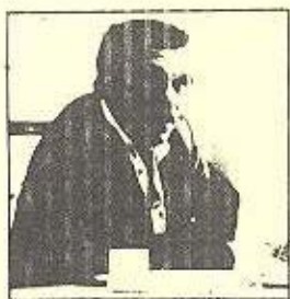
خهلاتی نوبل درا به دیرنک وه لکوت