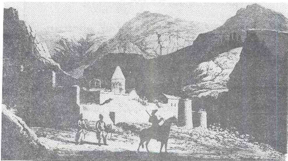
گوندېكى ئەرمنى له كوردستاندا

له رۆژنامى ئەرچىئە لوور Vertchine Lour ی ئەرمەنىيەوه وەرگىزاوه، رۆژى ۱۹۲۰/۲/۲۷