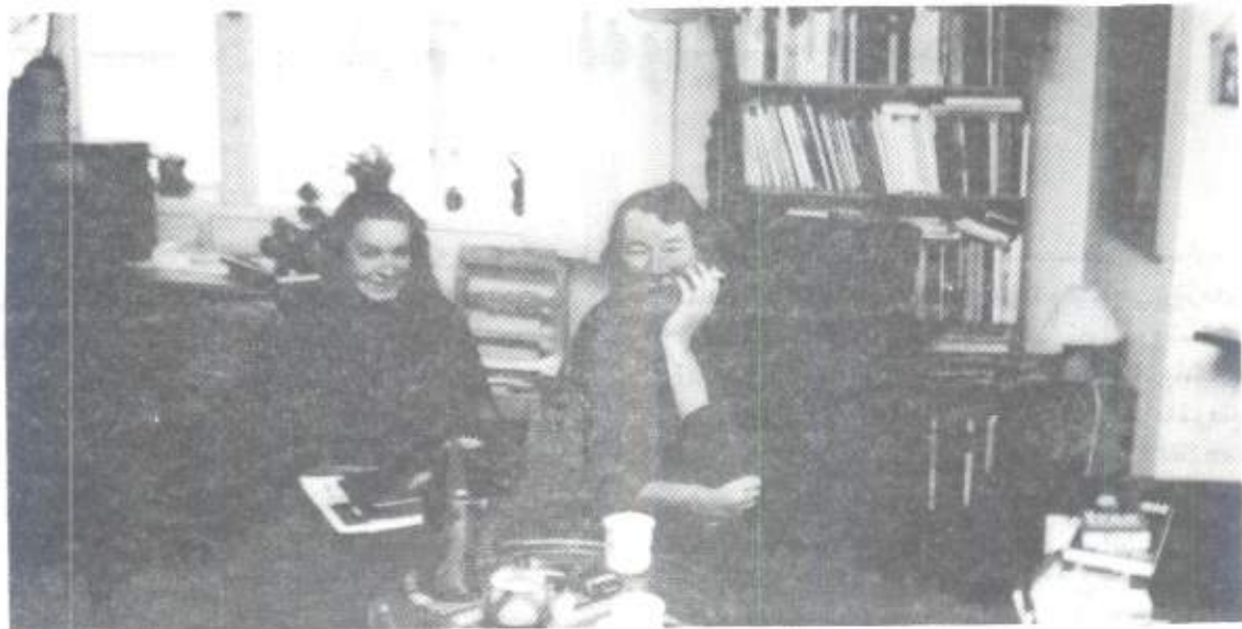
سیتی و لیتای هاوسهری

سهرتهای بههاربوو بهلام لهشاری رنگ خۆلهمیشی