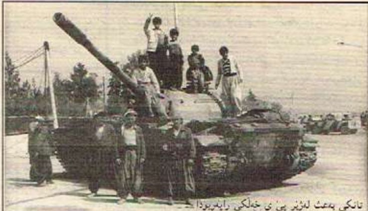
تانکی به‌عث له‌ژیر پی‌ی خه‌لکی راپه‌ریوه‌دا

مانگی چاره‌که کیلۆگرامیک شه‌کر، چاره‌که کیلۆگرامیک رۆن، نیو کیلۆگرام برنج، یه‌ک قالب سه‌یوون و 5 که‌غم نارده‌ی به‌رده‌که‌وت. خه‌لکی ره‌ش و رووت له زۆریه‌ی ماقه سه‌ره‌نایه‌کانی سه‌ره‌قابه‌تی بی‌ی به‌ش بوون. دام و ده‌سه‌تگانه‌ی بۆلیس، ته‌من، نیه‌سه‌جارات، سه‌خا به‌رات... ته‌ده‌کو کورگی به‌سه‌ی که‌وتیه‌وه گه‌یانی خه‌لک. به‌تاوانی جۆز و جۆز خه‌لکیان له زیندانه تاربه‌که‌کاندا ترند ده‌کرد. بز تۆقاندنی خه‌لک په‌رێیا گه‌نده‌ی کوشتن و په‌رینی خه‌لکیان بلاو ده‌کرده‌وه.