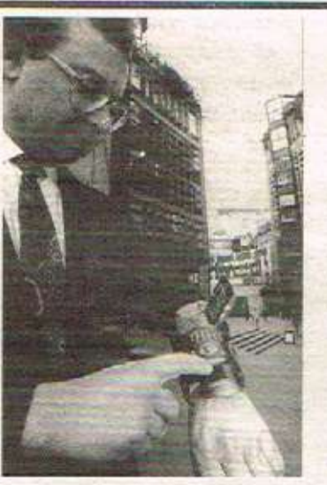
هەکارەینانی مەلێ مێدیوا یاریدەوهری پێشەنگتی مێدیوا

هەندیک گێرگرتی مەلێ مێدیوا لە گەل پێشەنگتی تەکنەلۆجیادا نامینیت. تا پانایی باند زیاتر بێت زانیاری دەتوانرێت بە هێلی کۆمپیوتەریشەکاندا بگۆزرتەوه. سەرکۆتینیکێ تری مەلێ مێدیوا بەستراوە بە پێشەنگتی کۆمپیوتەرەوه. مەلێ مێدیوا پێشەنگتی بە هارد دسک و بیرەوهری کۆمپیوتەری زۆرە. پێدە کردنی چەند تەپلیکەیشینیک لە بەگ کاتدا پێشەنگتی بە هارد دسک و بیرەوهری زۆرە. هەندیک کۆمپانیا هەر لە ئێستا بیر لە مەلێ مێدیوا گەرۆک دەکەنەوه. کە کارمەندی