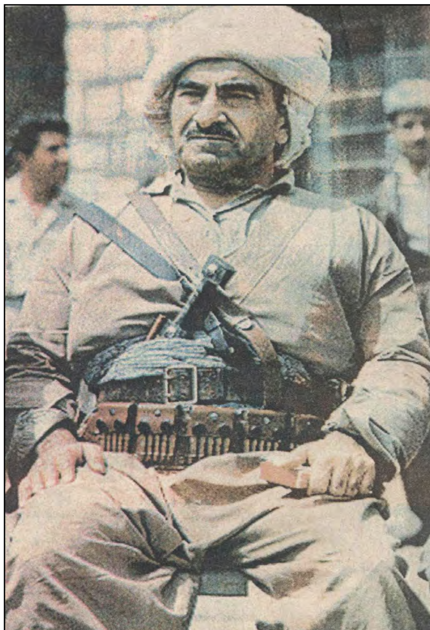
مه لا مسته فا بارزانی