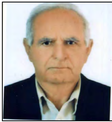
سه ید عه زیز عه له وی کورانه