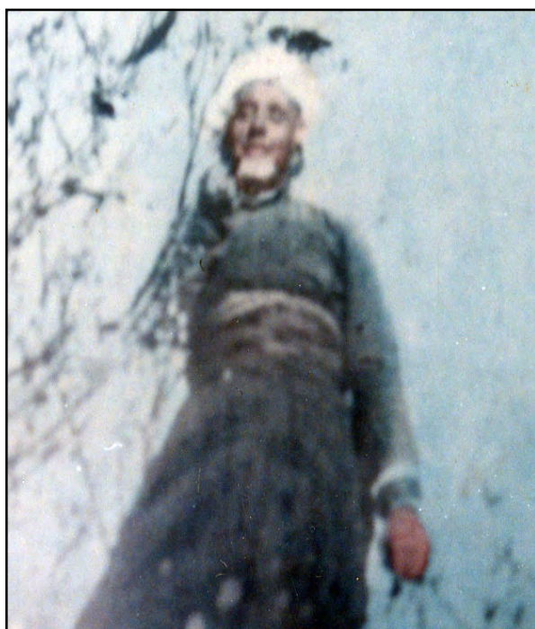
مه لا محه مه دئ سه یدا