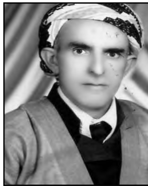
میرزا عه بدولا محه مه دی کلاسی