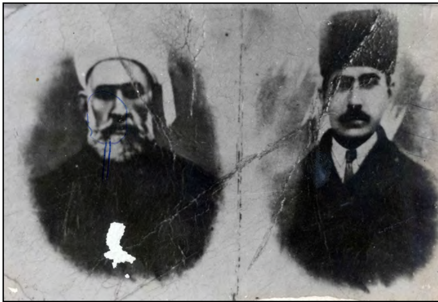
سه يد عبدولقادر گه يلانی