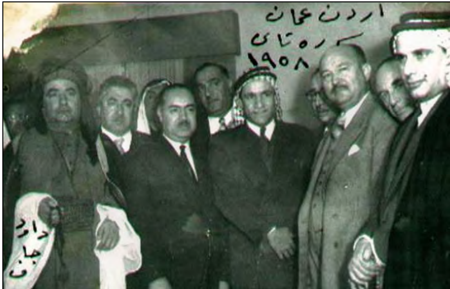
داود جاف له گه ل چه ند نوینه ریکی بهرله مانی عیراقدا