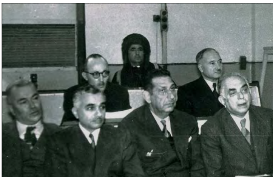
نوینہری کہ رکوک داود جاف له پەرله مانی عیراقددا له گهل نوری سه عید ئه حمەد موختار بابان ضیاء جه عفر و سه عید قه زاز دا