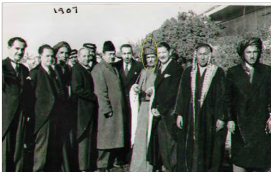
داود فه تاح جاف نوینہری کہ رکوک سالی ۱۹۵۶ له گهل نوینہری کہ رکوک مه محمود بابان و چہند نوینہریکی تری کہ کووکدا