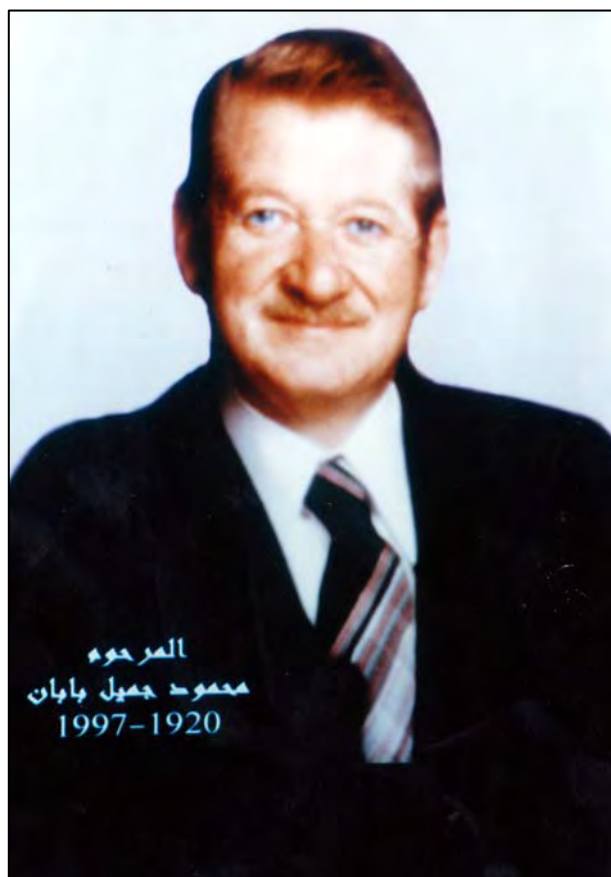
مهحمود بهگی جهمیل بهگی بابان