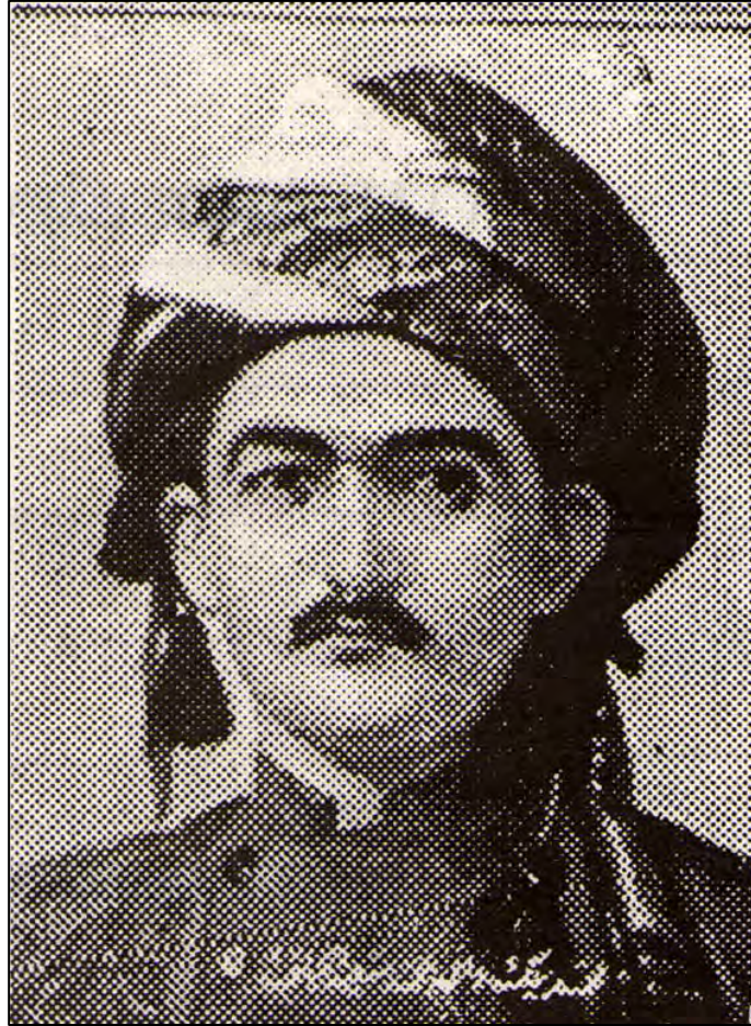
محهمهه بهگ فهتاه محهمهه پاشا جاف