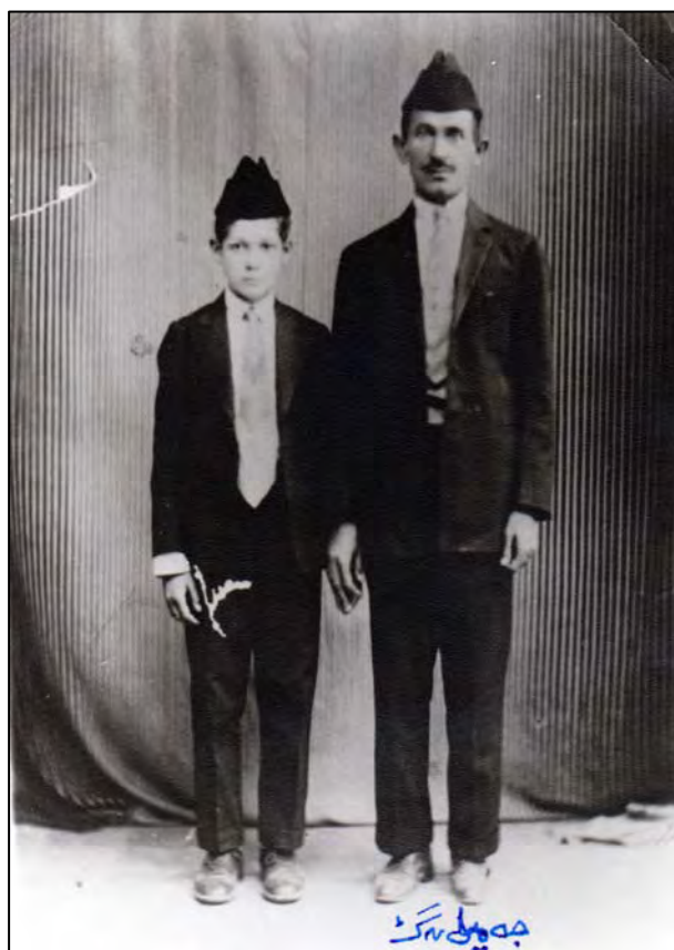
جهميل بهگ کوپری مهجید پاشا کوپری قادر پاشا کوپری ئیبراهیم پاشا سالی ۱۸۸۴ له دایک بووه، سالی ۱۹۴۶ کۆچی دوایی کردووه سالی ۱۹۲۴ له ئهنجومهنی دامهزاندنی عیراقدانویینهری لیوای کهرکوک بووه سالی ۱۹۳۳، ۱۹۳۷ ، ۱۹۴۴ نوینهری لیوای کهرکوک بووه له ئهنجومهنی نوینهرانی عیراقدان.