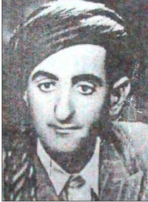
فہقی محہمدی مورتکھ

سہرؤکی تیرہی رھشہوہن، نائیب بووہ لہ مہ جلیس نوابی کھ رکوک