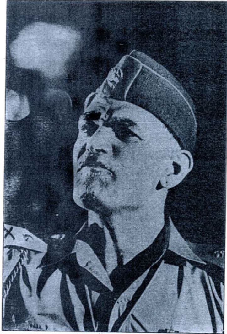
عبدالكریم قاسم - ۱۹۶۳ -