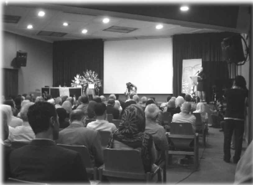
۲۰۰۷/۸/۱۲ مەراسیمی ریزلینان لە دوکتۆر ئیبراهیمی یونسی لە کۆشكى ھونەر