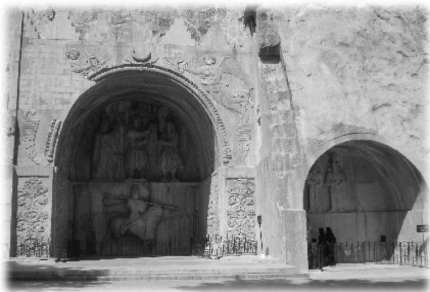
شوینه‌واری میژوویی (تاق وهسان) له شاری (کرماشان) ۲۰۰۷/۸/۶