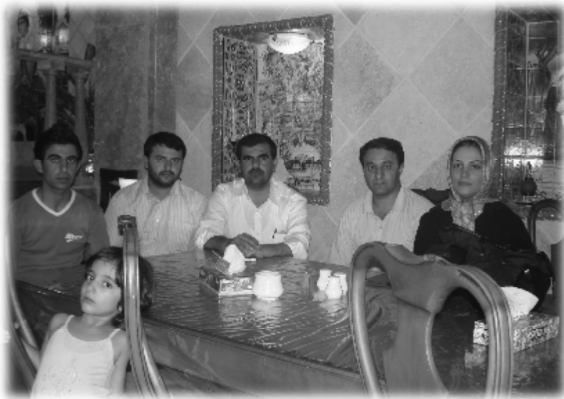
۲۰۰۷/۸/۷ ئامادەكاران لە داوھتییكى خانەوادەى ئایەتى محەمەدییىدا