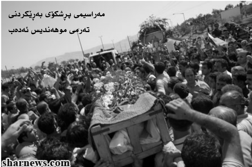
مه راسیمی پرشکۆی به ریکردنی ته رمی موهه ندیسه شه ده ب

له بهرچاودا یه که سێک به سه به ته یه که وه کلێنسه به شه شکه گهرم و سویر ته پر بووه کانی کۆ ده کرده وه، برۆا بکهن کلێنسه کان فرمیسکیان لی ده چۆرا، فرمیسکی کی؟ هی په رله مانتارو نووسهرو سیاسه ته داره کورده کانی رۆژ هه لات، له وی کوردی سوننه و شیعه و ئیسلامی و عهلمانی پیکه وه ده گریان، گه وره یی شه ده ب هه موویانی کۆ کرد بووه وه، شه ده ب چه تر یکی گه وره بوو کورده کانی ته وای ئیران له سایه یدا کاریان