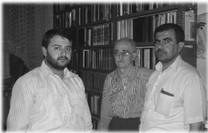
له راسته وه (سه لاج سالار - محهمه د رهئوفی ته وه گولی - محهمه د جه مال)