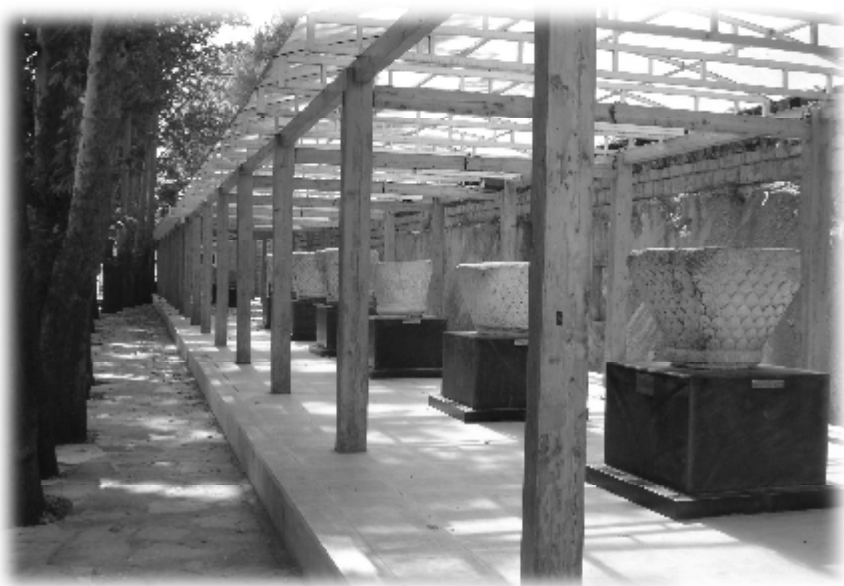
چه‌ند پارچه شوینه‌واریکی میژوویی له (تاق وهسان) ۲۰۰۷/۸/۶