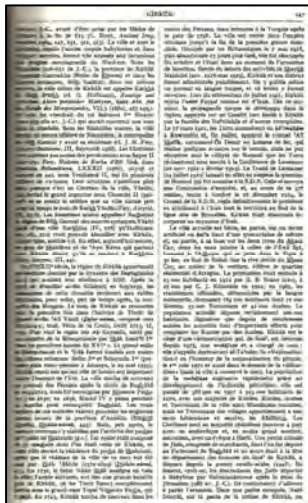
لاپه ره ١٤٧ ی وتاری که رکوک به فه ره نسێ

به ناوی (که رخای بیټ سلوق) ناوی هاتوو (٦) . ئەم ناوانە ی که رکوک له لایەن نیکاتۆری پاتشای سلوقی یەکەم (دەرووبەری ٢٥٥-٢٨٠ ی پ.ن) هوه لیتراوه، که له ناو قەڵاکە دا بورجیکی دروست کردوو و تەنانەت له دەورانی ساسانییه کاندا که رکوک هیشتا هەر ناوەندیکی به ناویانگی نهستورییه کان بووه، سه رۆکی ئەسقه فەکانی (بیټ گەرما) ی تیدا ژیاوه (٧) . مه سیحیه کان له دەورانی شاپووری دووه مدا له وه که متر به رهو پووی چهوساندنه وه نه بوونه ته وه به تاییهت له سالی ٤٤٥، چهوساندنه وه ی مه سیحیه کان له دەورانی یه زده گهردی دووه مدا، چه ندان هه زار قوربانی لیکه وته وه (٨) . دواتر په وشێ مه سیحیه کان چاکتر بووه، چونکه له دەورانی شوُسروسی دووه م (٥٩٠-٦٢٨ ی زایین)، یه کیک له مه سیحیه کانێ شاره که، به ناوی یه زده ین کراوه به وه زیری دارایی، ئەوهینده به ناو و شوهرت بوو، تەنانەت زیدی له دایکبوونی بۆ ماوه یه ک ناوی (که رخی یه زده ین) ی به خووه گرتبوو (٩) . میژوونوسه عه ره به کان به ناوچه ی (بیټ گەرما) ی سه رچاوه ئاشوورییه کان ده لێن (بادجرمای). یاقووت باسی شاریک ده کات به ناوی (که رخینه) (١٠) که هۆفمان (١١) پێی وایه و پیک به شاری که رکوکی ده ناسیته وه. راستیه که ی ئەمپرو هیشتا که، خه لکی شه قلاوه و عه نکاوه که سه فه ری که رکوک ده که ن ده لێن ده چین بۆ (که رخینه) (١٢) .