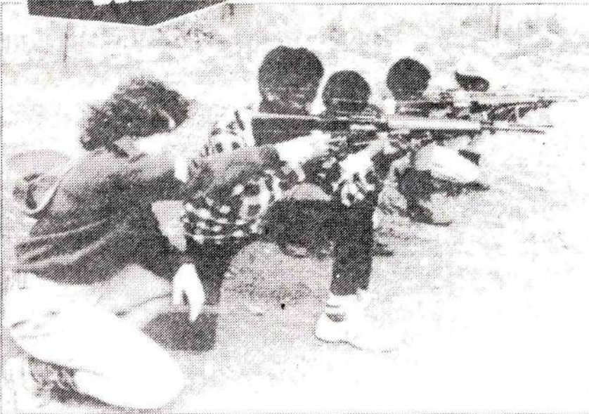
İsrail'in yeni milis güçleri...

Bilindiği gibi Kara Afrika kıtasında binlerce insan açlıktan yaşamını yitirmektedir. Etyopya halkı da aynı felakete maruz kaldı. 42 milyon nüfuslu Etyopya'da resmi olmayan verilere göre 25-30.000 Falaşa (Zenci Yahudiler) yaşamaktadır.