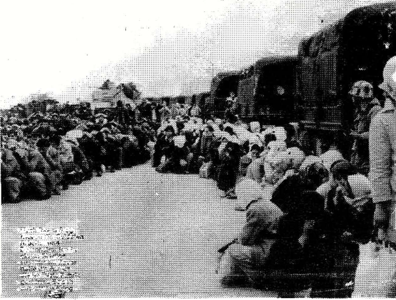
Faşist ordunun operasyonlarından bir görüntü

Hatayda durum daha da kötüydü. Mevcut zaman içinde ancak iki kez gidebilirdim. İkinci gittiğimde, biz sırada beklerken, yaşlı bir Kürdistan'lı ağlıyordu: "Benim oğlumu burada döve döve deli ettiler. Şimdi Ela zığ'da yatıyor. Burada oğlumun parası ve eşyaları var, onları almak için geldim" diyordu. Bir gardiyan yanına geldi ve "senin oğlun yine buraya gelecek, onun için hiçbir şeyini veremeyeceğiz"