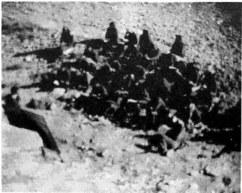
Partizanên HRK di fêrbûna ramyarî dene

me rewâ ditin hizir dikirin kû vî geli serê xwe liber dijmin daniye û êdî nema gotina serxwebûn û azadiyê têne ser ziman jî. Mesela Kurdistan û rizgariya netewayî ya vî welata kû neşîyan bi şûr xelas bikin, hizir dikirin kû bi politîka netewa gorinê jî dirokê û rojgar paqij kirine. Û vêca neha, di rêberîya Partîya Karkerên Kurdistan da di tekoşina li girtîxanan, li çîyan, li deştan û di bombayên kû dinav qereqolên wan de teqîyan da dema zindibûna vî geli ditin, weki miriyekî jî gorê rabûbe ditibin tirsana wan ne tiştêki neyê têtêgihîştine. Lêbelê li demeke nêzik tiştêki di kû ewanan baş fêribibin heye, ew jî eve; yek gel çiqasî diqirkirinan da bê derbaskirin bila bêderbaskirin, eger yek kes jî lipaş bimênî û eger xwe-diyê şerefeke jî rêzê jibi, mecbûre hesabê şûrên kû di singa gelê wî da çikandine û kêşane, bi xwîna mirovên wî hatine şûştin bipirsî, jibo vêya hêzê çekî û bûhayê vena giran jî dijmin bistênî. Burjuwayê kolonyalist kû bi devê xwe gunehbariya diji gelê me kiriye dibêjî, beramberî vî serê kû bi politîka şûr û netewa gorinê bi çî rengî neşîyaye bipercîqênî hinbihin ewê hin pêtir