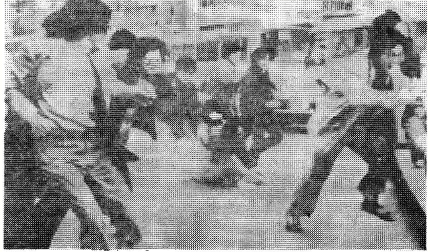
Güney Kore halkı ile faşist güçler arasında çıkan çatışmalardan bir görüntü

yaşadığı derin bunalım Güney Kore'yi de etkilemiş, sürekli zor sistemini daha da katmerleştirmiştir. Son yıllarda tutuklama, baskı, işkence ve katliamın boyutları daha da artmıştır.