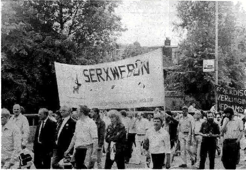
Kürdistan bağımsızlık mücadelesine bir yürüyüş esnasında desteğini sunan bir grup Avrupalı demokrat

Bu yeni yayın organından beklentim, onun Kürdistan sorunu üzerindeki tartışmalarda geniş bir foruma doğru gelişmesi, bizleri bu kurtuluş savaşına yakınlaştırabilmesi ve dayanışma çabalarımızı da ileteceğimiz yazılarla, yansıtması olacaktır.