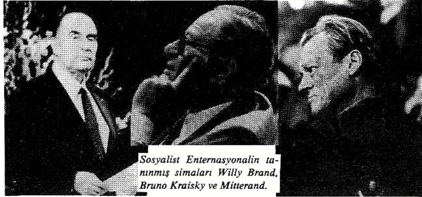
Sosyalist Enternasyonalin tanınmış simaları Willy Brandt, Bruno Kraisky ve Mitterand.

Önümüzdeki süreçte Bruno Kraisky bazı Arap ülkelerini ve İsrail'i de kapsayan bir gezi sürdürecektir. Bu gezide, Sosyalist Enternasyonalin görüşünü yansıtan Ortadoğu "Barış Planı" sunulacağı belirtilmektedir. Yine daha önce gerçekleştirmiş olduğu Hindistan ziyaretinden sonra Kraisky,