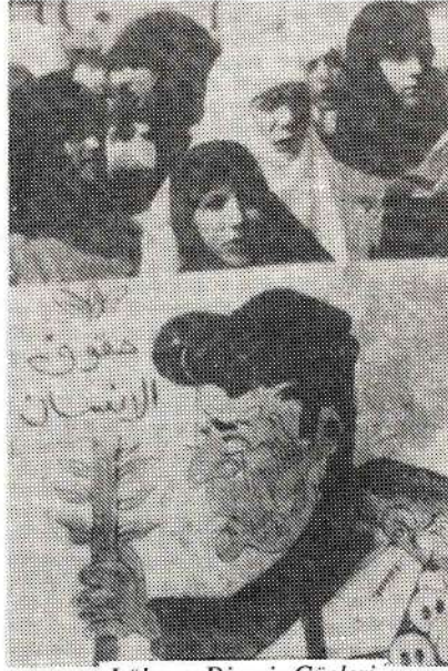
Lübnan Direniş Güçleri sonuca ulaşmada kararlı.

gerçekleşmesinde tüm güçler mutabık olmuşlardır. Hatta hristiyan kesim bile buna tepki göstermemiştir.