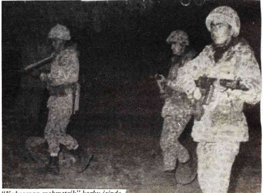
"Kahraman mehmetçik" korku içinde.

nöbet tuturan karakol komutanları, çok geçmeden bu nöbetlerin devrimcileri korumak için tutulduğunu öğrenerek kudurmaktadırlar. Yine operasyonlarda hiç bir ize rastlamayan bir birliğin komutanı, "kime soruyorsak, devrimcileri hiç görmedik, buralara gelmediler diyor. Halbuki bu alanda barındıklarını biliyoruz. Sanki tümü şartlandırılmış, tembihlenmiş gibi" diyerek halkımızın kararlılığı ve mücadeleye