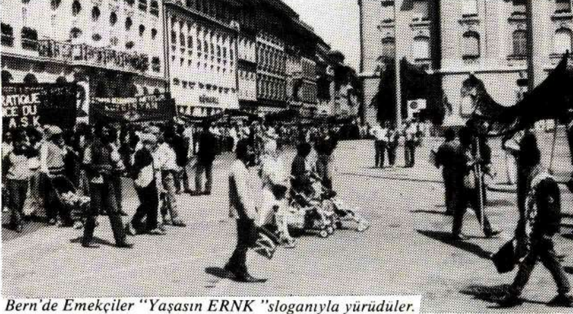
Bern'de Emekçiler "Yaşasın ERNK" sloganıyla yürüdüler.

29 Haziran 1985 günü yapılan yürüyüş eylemi, ERNK'nin tanıtılması ve desteklenmesi amacıyla 21 Mart 1985'ten buyana sürdürülen faaliyetle-