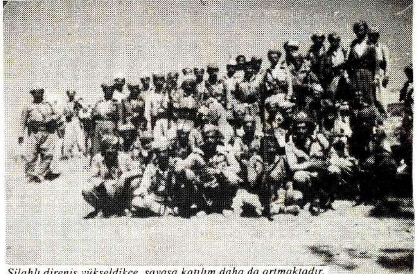
Silahlı direniş yükseldikçe, savaşa katılım daha da artmaktadır.

devrimden uzaklaşmaydı. Ne derirse densin, ortaya çıkan durum bundan başka birşey değildir. Peki, bu güçler ulusal kurtuluşun en can alıcı sorunlarına yaklaşmıyorlar diye herşeyden vaz mı geçilecekti? Dökülen bu kadar şehit kanına, çekilen bu kadar acıya ve yine görülen bu kadar katliama rağmen, herşey olduğu yerde mi bırakılacaktı? Açık ki bu hiçbir gerekçeyle kabul edilemeyecek bir durumdur. O halde yapılması gereken neydi? Verilen söze de bağlılığın bir gereği olarak Ulusal Kurtuluş Cephesi'nin ve bir bütün