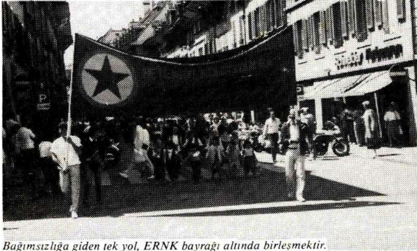
Bağımsızlığa giden tek yol, ERNK bayrağı altında birleşmektir.

Bu konuda gerekli olan birçok özellikten bahsedilebilir. Kuşkusuz bunlar sağlandığı oranda sonucu alınması mümkündür. Aksi takdirde beklenmeyen sonuçların ortaya çıkması da kaçınılmazdır. Savaşın boyutlanması karşısında, bu özellikler giderek daha fazla dayatıcılığını gösterecektir. Fedakarlığın, inancın daha da geliştirilmesi sağlanırken adeta iğne ile kuyu kazarcasına birçok adımı da atmak