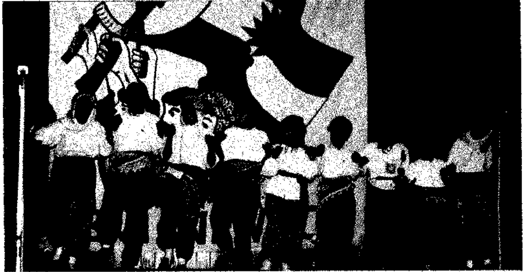
GELECEĞİN UMUDU ÇOCUKLARIMIZ BREMEN NEWROZUNDA

Süreci değerlendirmemiz, bu süreçte TSK olarak, yapmak istediklerimiz ve attığımız adımlar