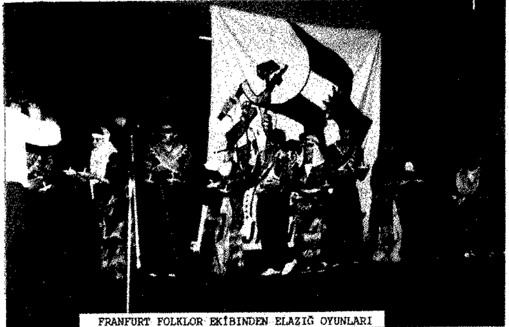
FRANKFURT FOLKLOR EKİBİNDEN ELAZIĞ OYUNLARI