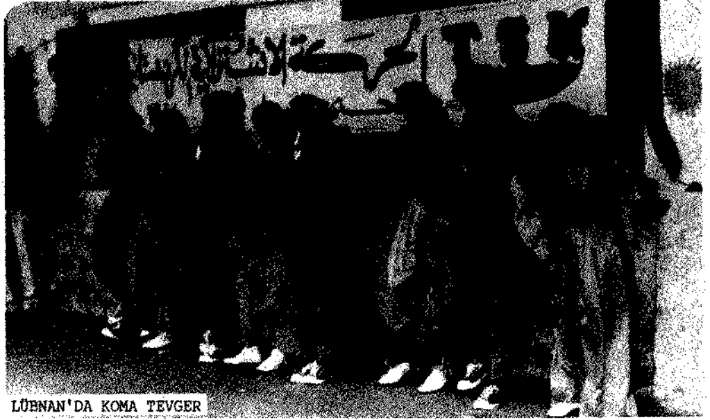
LÜBNAN'DA KOMA TEVGER

Ayrıca değişik yerlerde ateşler yakıldı; Newroz ateşi silahların ateşleriyle birleşerek yankılandı.