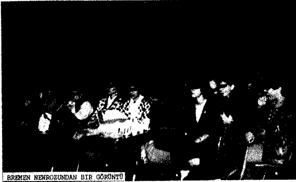
BREMAN NEWROZUNDAN BİR GÖRÜNTÜ

dile getirildi. Konuşma, sık sık "yaşasın direniş kahrolsun teslimiyet", "biji peşmerge", "biji TSK" "biji newroz" sloganlarıyla kesildi.