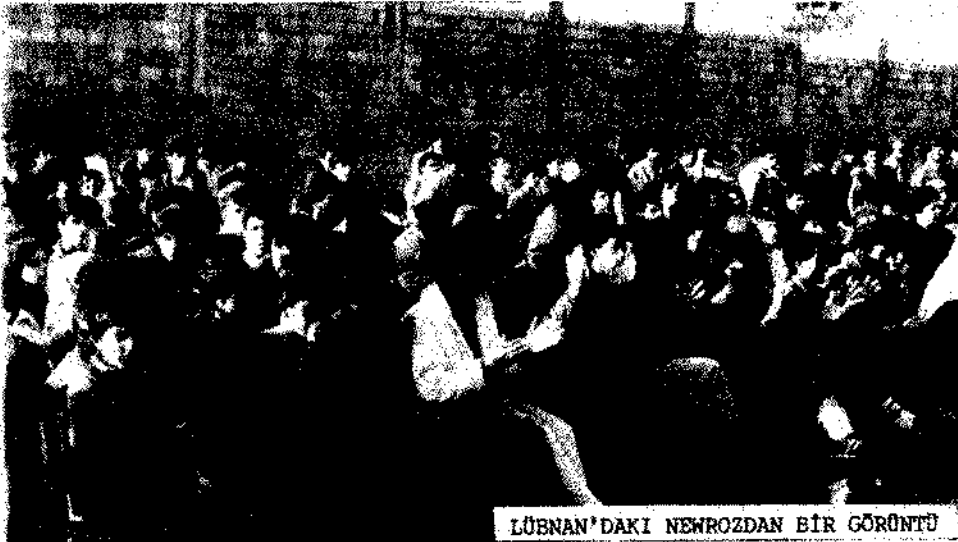
LÜBNAN'DAKI NEWROZDAN BİR GÖRÜNTÜ

Program, Koro'nun ey newroz marşını söylemesiyle açıldı. Saygı duruşu ve ardından TSK Avrupa komitesi adına bir yoldaşın yaptığı konuşmayla sürdürüldü. Konuşmada, yaşadığımız sürecin önemi, mücadelenin gelişim seyri, TSK olarak bu süreçte nasıl müdahale etmek istediğimiz ve bu doğrultuda