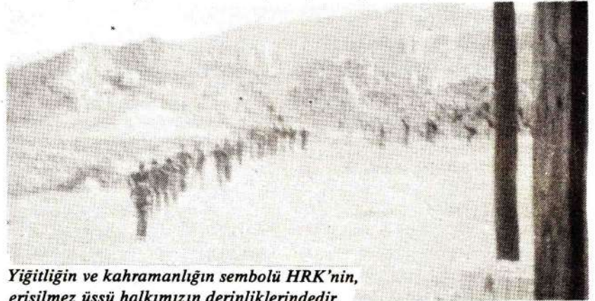
Yiğitliğin ve kahramanlığın sembolü HRK'nin, erişilmez üssü halkımızın derinliklerindedir.

vererek kendi köylerinizi korumanızı sağlayacağız." Komutanın konuşması bitince yukarıda bahsettiğimiz K... köyü muhtarı söz istemiş ve şöyle bir konuşma yapmış: "Onlardan bize bir zarar gelmez. Eğer siz bize silah verip onlara karşı bizi kışkırtmazsanız, bizler tarafından rahatsız edilmezlerse kimseye hiç birşey yapmazlar. Biz de onları rahatsız etmekten korktuğumuz için sizin verdiğiniz silahları almak istemiyoruz. Bir devletin görevi vatandaşlarını korumaktır. Siz de devlet olduğunuza göre, bir kaç asker gelsin her gece köyün etrafında nöbet tutarak güvenliğimizi sağlasın. Benim oğlum