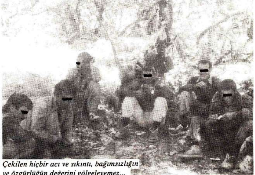
Çekilen hiçbir acı ve sıkıntı, bağımsızlığın ve özgürlüğün değerini gölgeleyemez...

Gümrük kapılarında o bilinen uygulamalardan nasibimizi aldıktan sonra yola çıktık. Sivas-Kayseri alanını geçtikten sonra değişik bir yere geldiğimizi farkettilik. Çünkü geçtiğimiz tüm yerleşim alanlarında neredeyse sivilden çok asker vardı. Önce buna anlam veremediysem de mücadelemizin gelişimini düşününce bunun bir işgal hareketi olduğu sonucuna vardım. Köyümüzdeki durum ise bu düşüncemi daha da pekiştirdi. Köyümüz geçmişten beri sarp dağlarla sarılı ve patika bir yoldan başka ulaşım olanağının bulunmadığı bir yerdir. Son yıllarda zor-bela taşılı bir yol yapmışlardı, ama o da pek işe yaramıyordu. Yine önceleri burada birkaç jandarma haricinde fazla asker de kalmıyordu. Ama bu yıl oldukça farklı bir görüntüyle karşılaştım. Öyle ki köy nüfusundan çok asker yığılmıştı. Köyde bir de karakol kurmuşlardı. Çevrede de birçok mezra ve küçük köy bulunduğundan burayı merkez olarak seçmişlerdi.