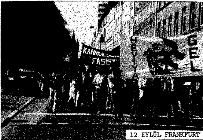
12 EYLÜL FRANKFURT