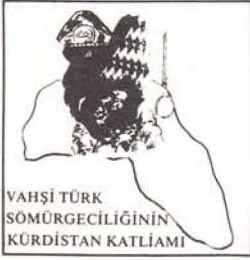
VAHŞİ TÜRK SÖMÜRGEÇİLİĞİNİN KÜRDİSTAN KATLIAMI

Çağdaş halklar arasında bağımsız ve özgür bir halk olarak yerini almak için bugün Kürdistan halkının, sömürgeci egemenliğe karşı yürütmüş olduğu ulusal direniş mücadelesi yeni bir dönüm noktasına gelmiş bulunmaktadır. Kürdistan'da yükselen ulusal direniş mücadelesiyle temelleri sarılarak, her geçen gün yok olmanın eşiğine sürüklenen faşist Türk sömürgeçliği, atalarından devraldıkları sürgün, soykırım ve baskı metodlarını bugün daha acımasızca ve sinsice hayata geçirip insanlıkdışı uygulama ve çabalarla bütünleştirerek halkımızı topyekün imha etmenin savaşını vermektedir.