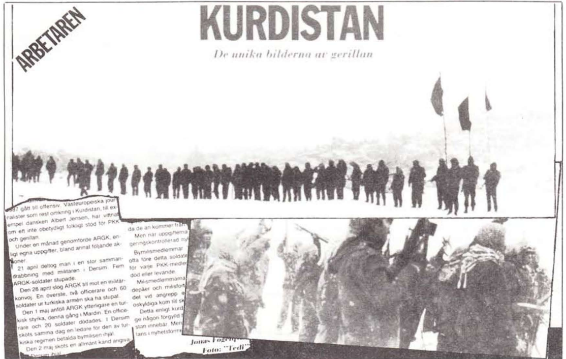
"Arbetaren" gazetesinde çıkan yazının bir bölümünü yayınlıyoruz.

"Kürdistan İşçi Partisi-PKK önderliğindeki Kürt gerillaları 1983'ten bu yana Türk ordusuna karşı savaşıyor. Hedef; bağımsız bir Kürt devleti.