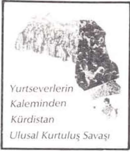
Yurtseverlerin Kaleminden Kürdistan Ulusal Kurtuluş Savaşı

Lavrion kampında çıkan son olaylar, tüm demokrat, ilerici ve yurtseverlere çok şeyler öğretmiştir.