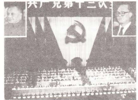
Beijing Büyük Halk Salonu'nda yapılan ÇKP 13. Kongresi ve Kongrenin en etkinleri: Deng (solda) ile Zao (sağda)

Deng, önemli bir karar olarak Da Danışma kurulu başkanlığından ayrıldı. Yerine ona rakip olan kesimden biri