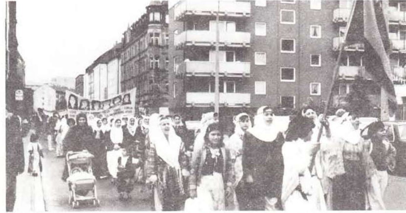
Faşist Türk sömürgeciliğinin Kürdistan'daki katliamlarını ve Alman devletinin TC'ye artan desteğini protesto etmek amacıyla Mart 1987'de Bonn'da yapılan Kürdistanlı kadınlar yürüyüşü

Kadın üzerindeki erkek egemenliği doğuştan edinilmemiştir. Bu, toplumun üretim sürecinin ürünüdür. Kadın da, erkek de bu eşitsizliği, devralmışlardır. Kadının düşürülmesi, bunalım yuvası haline getirilmesi erkeği de düşürmüştür, sorunlarını arttırmıştır. Sorun kolektiftir. Geleceğin özgür ve dengeli ilişkileri devrimci mücadele içinde yaratılır. Kadını köleliğe mahkum eden nedenlerin ulusal-toplumsal kaynaklarına