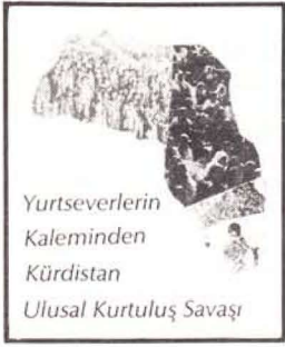
Yurtseverlerin Kaleminden Kürdistan Ulusal Kurtuluş Savaşı