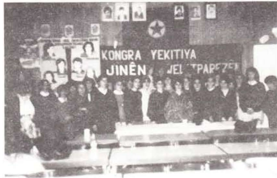
Destpêk rûpela dawî de

yekîtiya jinan jî xebatên xwe bi gelek şeweyan birêvebir. Encama wan xebatan de, li gelek navçan û êrdiman konferansên yekîtiyê pêkhatin. Rista û pêwîstiya jinan di şoreşê de, herwusa rewşa jinên Kurdistanê, pîrsa ketina jinan nav refên şoreşê û karguzarî û delametên jinan, jî ber çavan hatin derbaskirin û danûstandin di vê barê de çêbûn. Ev giştî mejiyan de û baweriyê de hatin ronahîkirin.