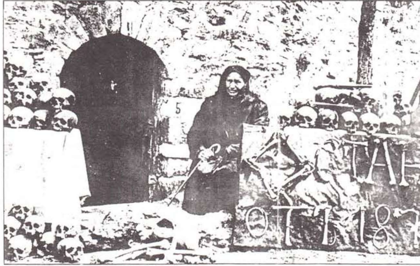
Batak Kilisesi'ndeki vahşetin bir görüntü - 1876

6 Temmuz 1837 doğumlu Vasil İvanov Kuçev, Bulgar tarihine Vasil Levski olarak geçer. Karlovo'da boyacılık yapan bir esnaf ailesinden gelir. 14 yaşında iken babasını kaybedince çok nüfuslu ailenin geçimi ile ilgilenmek zorunda kalır. Levski, rahiplik yapmaya çalışırken, Rokovski'nin Belgrad Lejyon'u'na çağırın Bulgar gençliğine hitabesini öğrenir ve tereddütsüz Belgrad'a gider. Ondan sonra Rokovski'nin devrimci düşüncelerinin derin etkisini taşımaya başlar. Karlovo'ya döndüğünde rahiplik çübbesini atar ve öğretmenliğe başlar. İki yıl sonra Yaş'a geçip Rokovski ile ilişki arar. 1867 yılında Panayot Hitov komutasındaki çeteyle, bayraktar olarak ülkeye girer. Bir sonraki yılda Levski Belgrad'ta yeniden Lejyon kıyafetini giyer. 2. Lejyon'un da dağılmasından sonra bir süre hasta yatan Levski, buradan Panayot Hitov'a tarihsel mektubunu yazar. Bu mektubunda vatani işin yüksek amaçlı bir işe atılmak üzere olduğunu şu sözlerle duyurur. "Tanrı izin verirse, kazanırsam, bütün bir halk