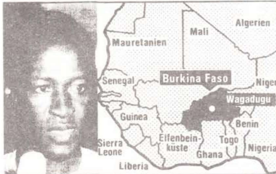
Burkina Faso'nun yeni lideri, öldürülen eski lider Sankara'nın yakın arkadaşı

274 200 km kare büyüklüğündeki ülkenin nüfusu 7,1 milyondur. Halkın %70'i animist (doğal dinlere inanırlar), %25'i müslüman, %5'i hristiyan dine mensuptur. Afrika'nın en geri ve yoksul toplumlarından olan Burkina Faso'nun 1983'e kadar adı Yukarı Volta idi. Son 27 yıl içinde 5 darbe geçiren ülkede, 1983'te darbe ile iktidar olan Thomas Sankara, ülkenin adını da değiştirdi.