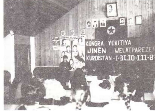
Yekitiya Jinên Welatparêzên Kurdistan Kongresinden bir görüntü

Çeşitli bölgelerde yapılan konferanslara temsilen katılan delegelerin bileşimiyle gerçekleşen Kürdistan Yurtsever Kadınlar Birliği I. Kongresi, güçlü kararlar alarak devrimdeki yerini belirledi. Sunulan siyasal raporun yanısıra kadın mücadelesinin özgül yanları açık ve net bir dille izah edildi. Yine çeşitli birliklerden gönderilen mesajlar da Kongreyi güçlendirdi. Ayrıca mücadelede safalarında şehit düşen ve zindanlarda direnen bayan yoldaşlar da birliğimizin onur üyeleri olarak alındılar. Siyasal raporuyla, birlik programı ve yönetmeliğini karara bağlayan Kongre, şu kararları aldı: