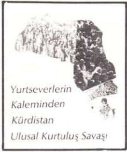
Yurtseverlerin Kaleminden Kürdistan Ulusal Kurtuluş Savaşı