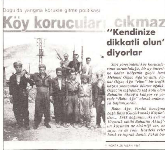
Köy koruculuğunun iflas belgeleri

Bize sürekli olarak “Apocuları vurmamızı” söylüyorlardı. Kendi aramızda bunla-