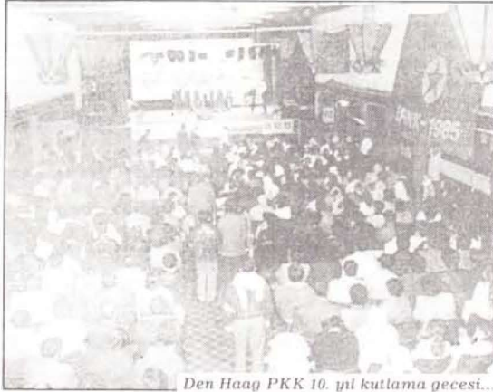
Den Haag PKK 10. yıl kutlama gecesi...

İsviçre'nin Freiburg kentinde 5 Aralık'ta yapılan geceye 3000, Hollanda'nın Den Haag kentinde yapılan geceye ise 1300 civarında ilericisi, yurtsever ve demokrat katıldı.