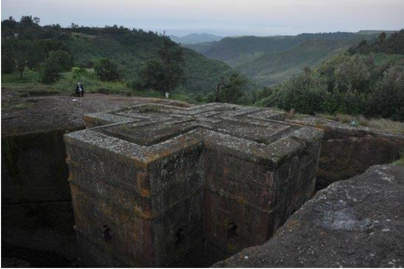
که نیسه ی سه ینت جوړج له لالیبیللا