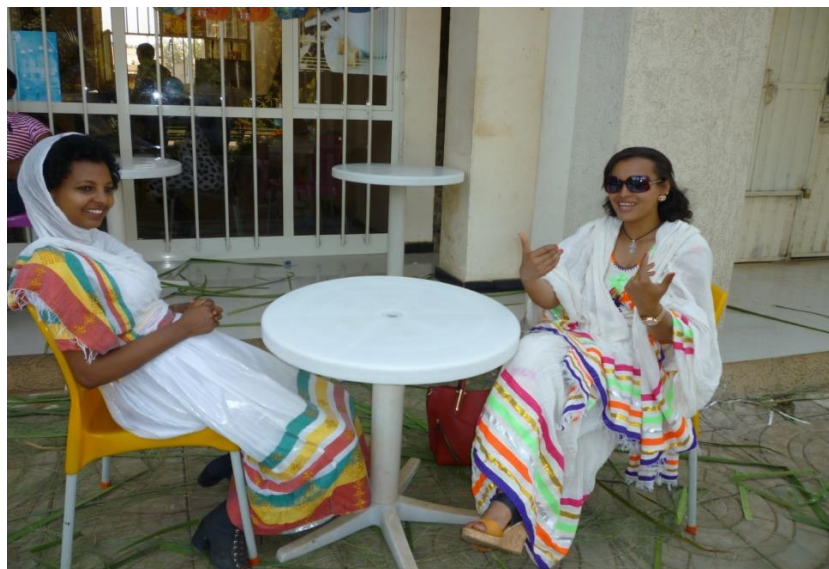
بی‌زا و مه‌سیره‌ت، دوو خوشکه‌که‌ی شاری به‌هردار