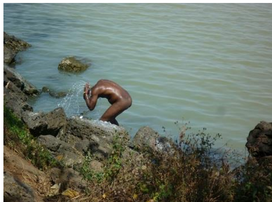
هه‌ژاریکی شاری به‌هردار، له‌که‌نار زه‌ریاچه‌ی تانا، خۆی و جله‌کانی ده‌شۆری