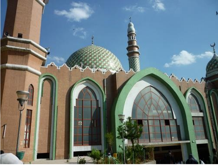
مزگهوتی ئەننووور (النور) لە ئەدیس ئەبابا