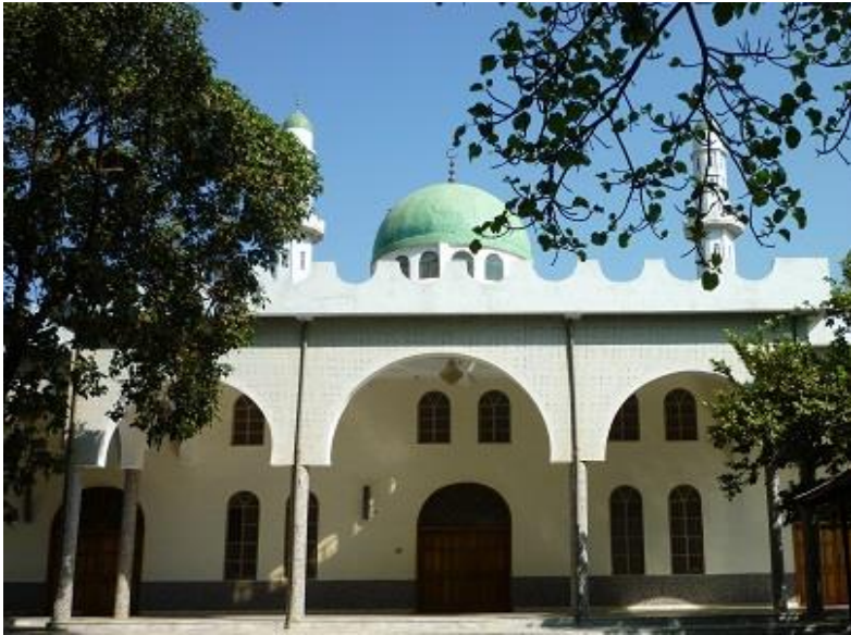
مزگه‌وتی سه‌لام یا سه‌لامه‌ت له شاری به‌هردار