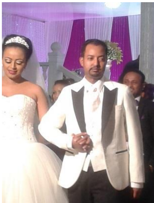
بووک و زاواکهی ئەدیس ئەبابا