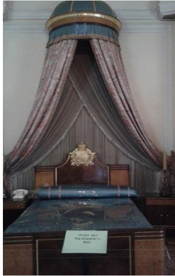
تهختی خهوتنی هایلا سیلاسی له موزه‌خانه‌ی ئەدیس ئەبابا