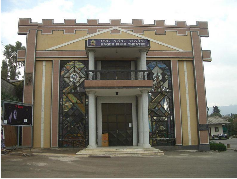
شانۆی هاجەر فیکیر له ئەدیس ئەبابا