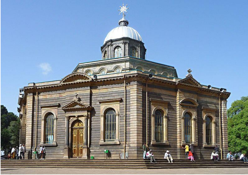
كاتدرالی سهینت جورج له ئەدیس ئەبابا