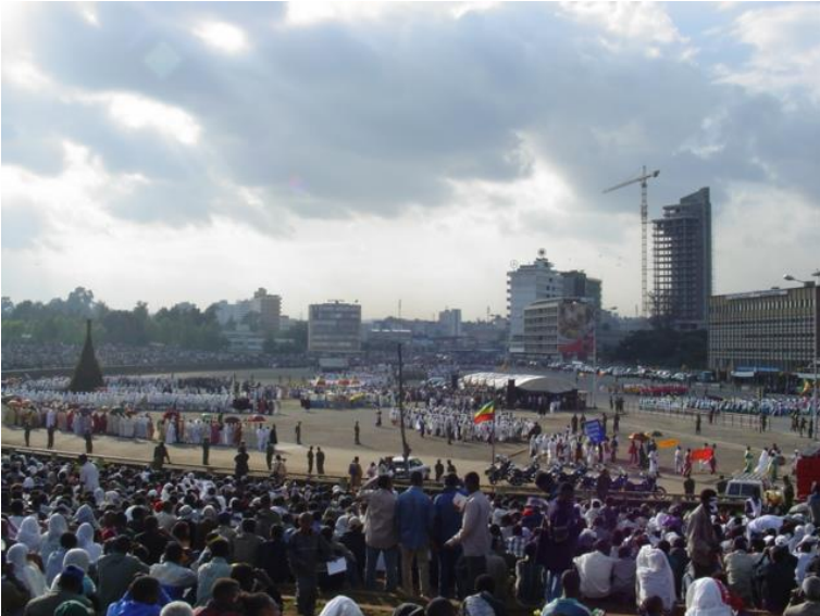
مهیدانی میسکال له ئەدیس ئەبابا