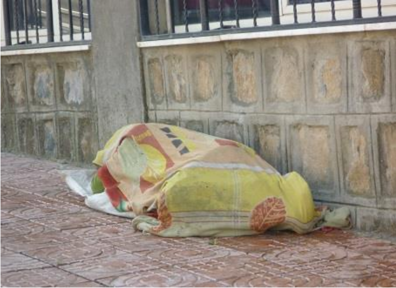
هه ژاریکی بئ مال له گوندەر