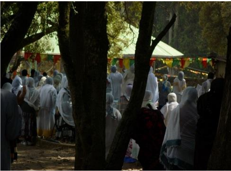
جهڙني تيمڪهت له بهردار