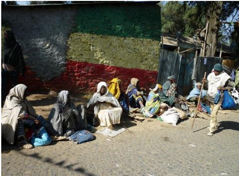
ده رۆزه که رانی گوندەر