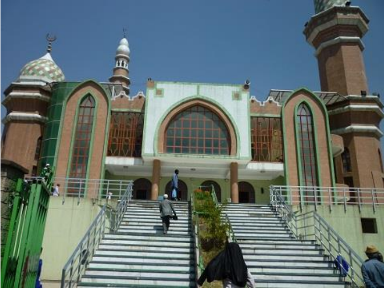
مزگهوتی ئەننووور (النور) لە ئەدیس ئەبابا