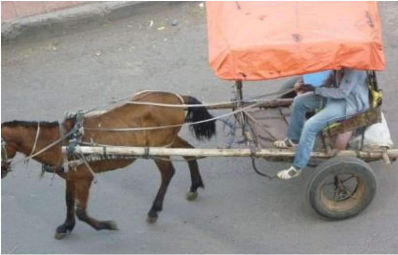
عەرەبانه و ئەسپ لە باژێری گۆندەر