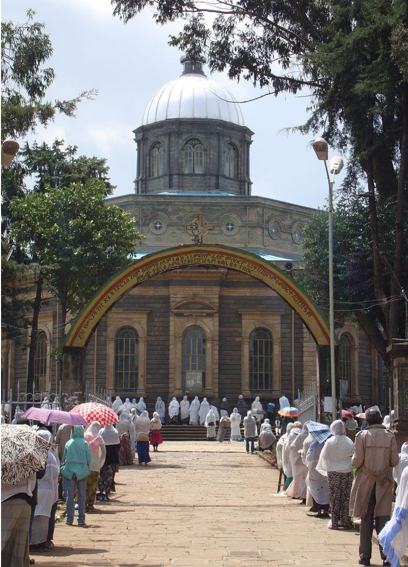
كاتدرالی سهینت جورج له ئەدیس ئەبابا