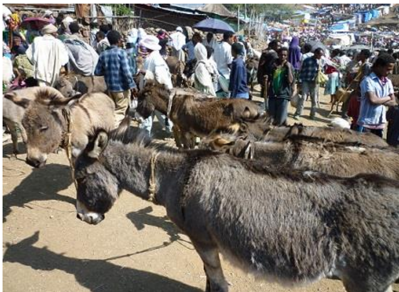
شهممه بازاره‌که‌ی لالیبیللا