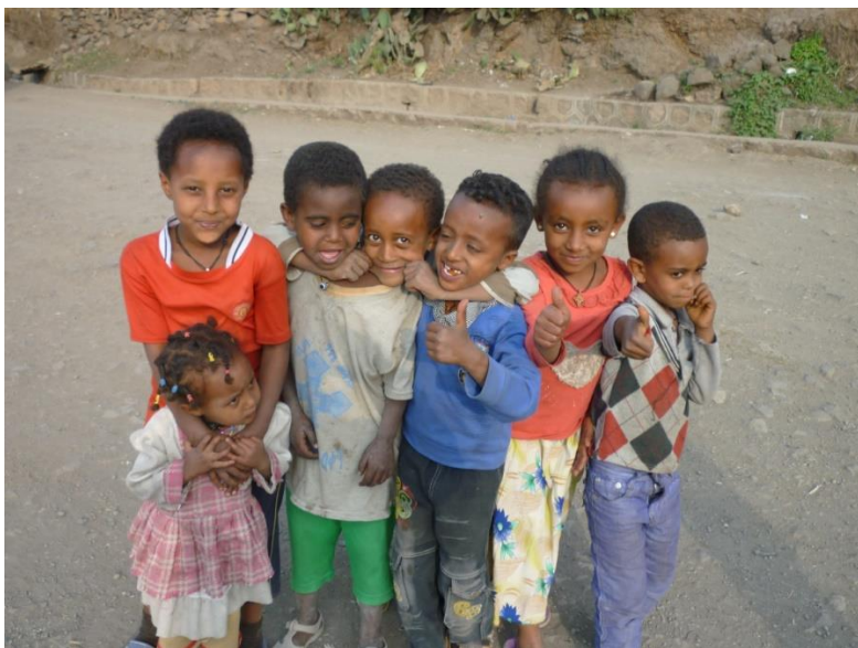
كۆمهلىك زارۆك له باژىرى لالبيىلا