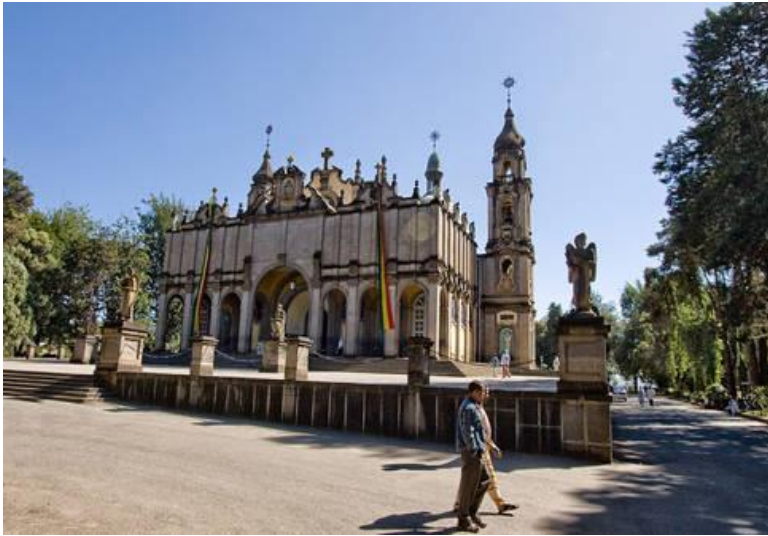
كاتدرالی سهینت جورج له ئەدیس ئەبابا