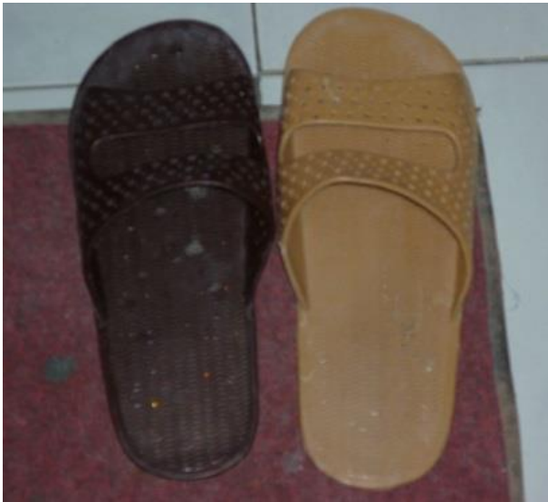
جووتە سه‌رپێیه‌کانی هۆتێله‌که‌ی گۆندەر