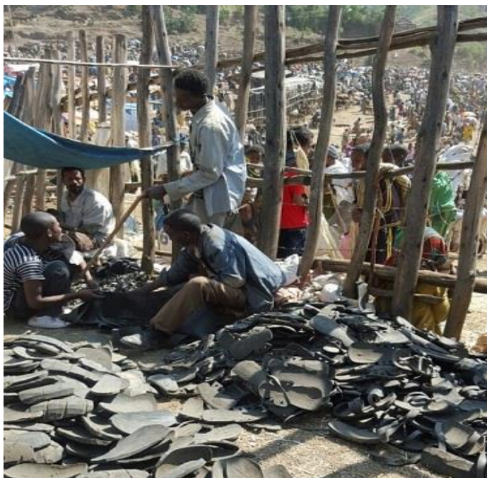
کارگهی کهوش دروستکردنی شه‌مه‌بازاره‌که‌ی لالیبیلا