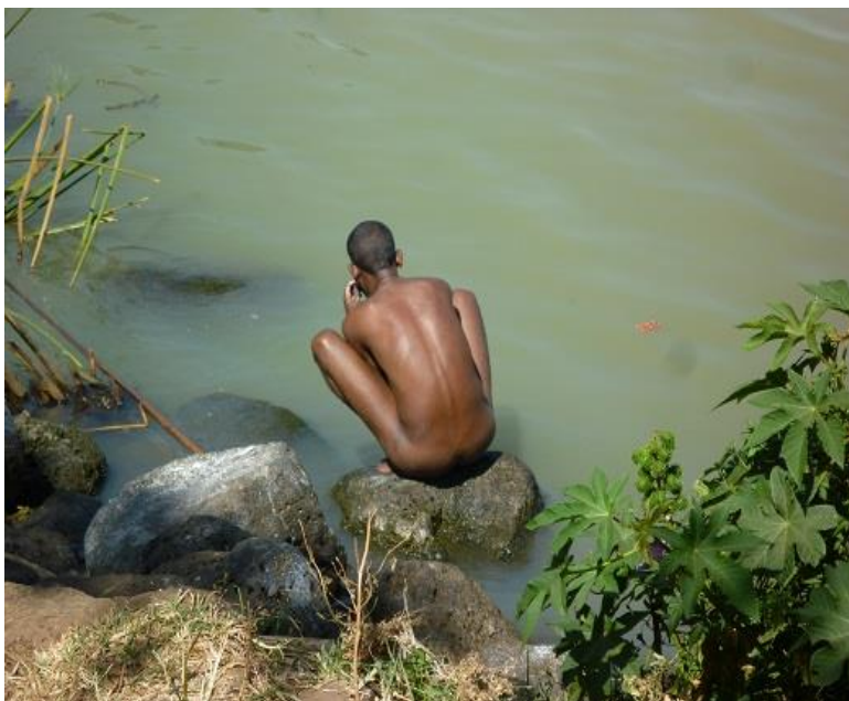
هه‌ژاریکی شاری به‌هردار، له‌که‌نار زه‌ریاچه‌ی تانا، خۆی و جله‌کانی ده‌شوا