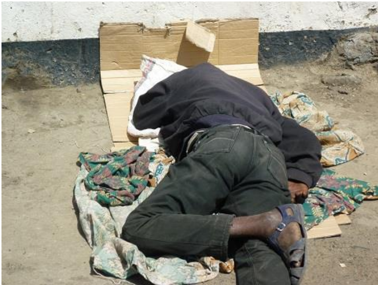
ههژاریک له ئەدیس ئەبابا