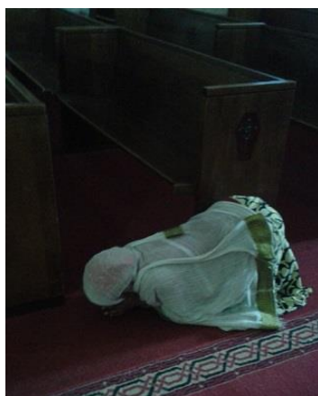
ژنیك له کلێسهدا له ئەدیس ئەبابا، کړنۆش دهبا و