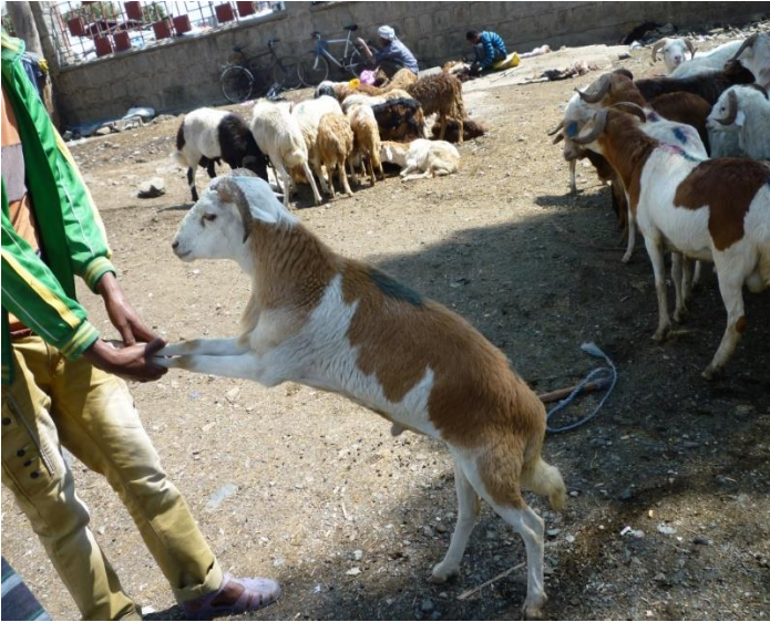
بازاری نازھل و جامبازان له ئەدیس ئەبابا