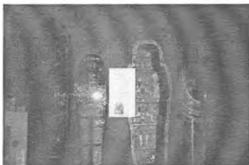
چەند تابوتتىكى كۈنى مىسىرى