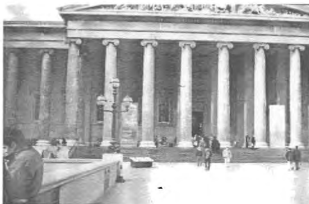
ئەمە وېنەنى ئەو مۇزەخانە يە كە شوېنە وارى جۆر بە جۆرى جىھانى تىادايە