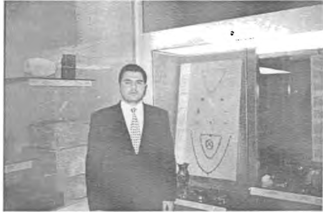
چەند ملوانکە یەکی کوردان

ئەم وێنانه لە مۆزەخانەی ( بریدیج میوزیەم ) لە سەنتەری لەندەن لە لایەن پارێزەر - ھەوراز ئیسماعیل عەدۆ / قوتابی ماستەر لە بواری یاسا لە زانکۆی لاڤ پەرگیراوە و بۆ گۆڤاری میژوو ناردراوە