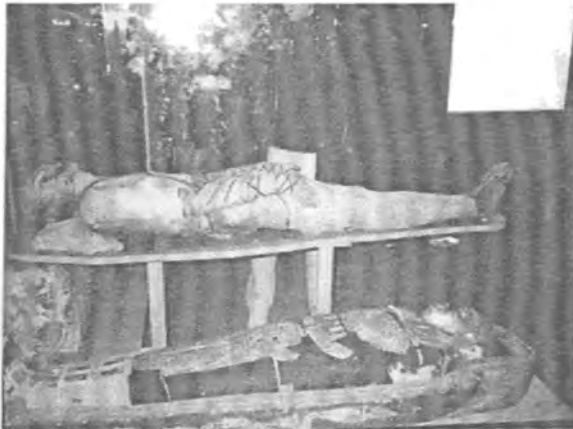
مۆمىيائى كۆنى مىسىرىيەكان