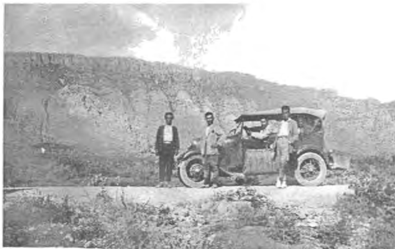
چيا رهش دهشتى ھەرير ١٩٣١/٨/١٦ وىنەى يەكەم تاكسى لە ھەولير عەبدوللا عەزىز بەرپۆھەرى قوتابخانەى شەقلاوھ لە سەر سوکانىيەتى