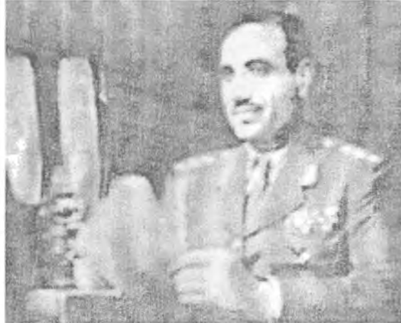
الرئيس عبدالرحمن عارف وهو يلقي بيانا من الاذاعة