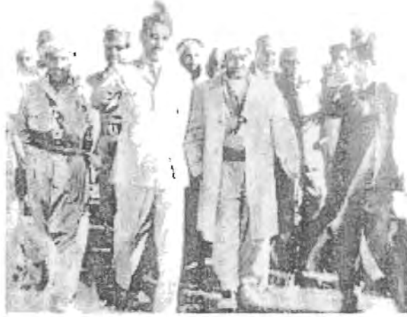
الرئيس عارف مع الزعيم البارزاني بمنطقة جنديان إبان اعلان ٢٩ حزيران