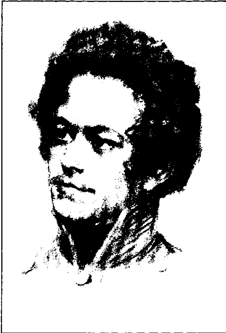
کارل مارکس له ته مهنی لایدا