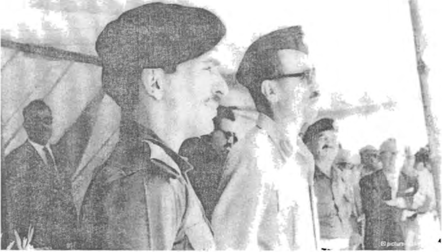
الرئيس عبدالرحمن عارف مع الملك حسين اثناء تفقدهما احدى الجبهات