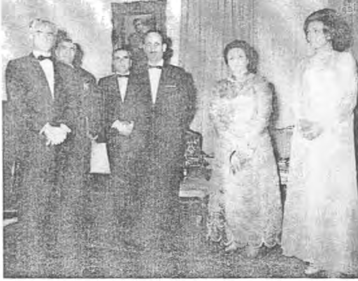
الرئيس عبدالرحمن عارف وزوجته السيدة فائقة في ضيافة شاه ايران محمد رضا بهلوي وزوجته الاميرة فرح ديبا سنة ١٩٦٦.