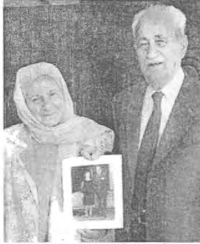
الرئيس العراقي السابق عبد الرحمن عارف مع زوجته يحملان صورة لهما عام 1966 في بغداد