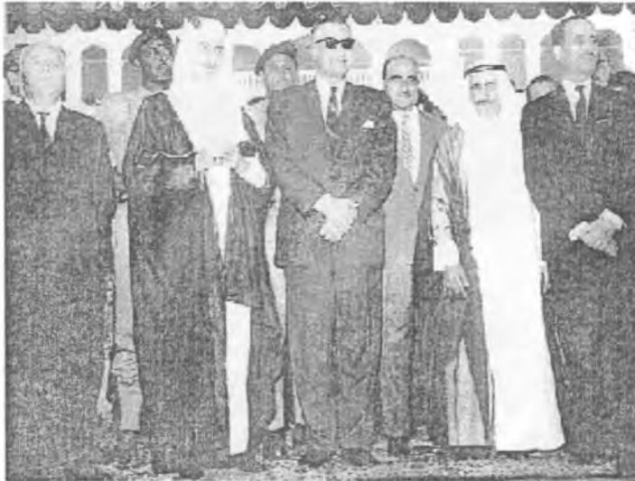
في القاهرة مع الرئيس جمال عبدالناصر والملك فيصل بن عبدالعزيز ملك السعودية