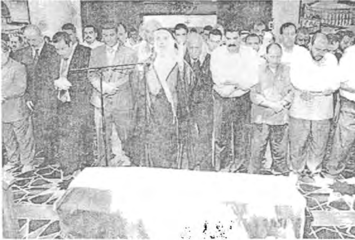
جثمان الرئيس الراحل عبدالرحمن عارف يصلى عليه بجامع عمان ٢٤/٨/٢٠٠٧