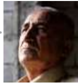
رانان: حه سهن مه حمود حه مه كهرىم