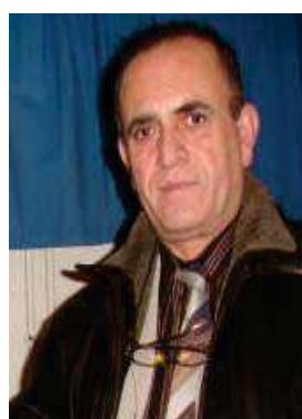
جەھا جەھا بەرزنجی

بلاوکردۆتەوہ، دواتر دابراون و پایدۆزیان لیکردووە. نووسەر و رۆژنامەنووسە ھەرە چالاک و