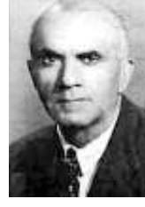
نه مين پاشاي دهواندزي (1941 - 1865 )