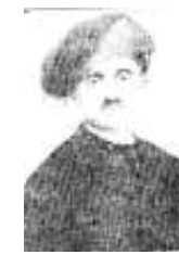
نه حمهد موختار جاف (1933 - 1896 )