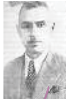
مه عرووف چیاووک ( 1885 - 1958 )