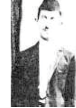
جەمیل بابان (- 1884)