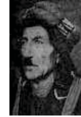
شیخ عه‌دو‌نوه‌هاب تالهبانی ( 1886 - ؟ )