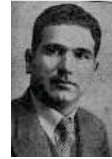
جەمال عومەر نەزعی (؟ - 1914)