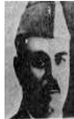
سەئید جەققى - 1883 )