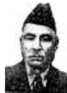
میرزا فهرج ( 1881 - )