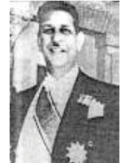
نه حمهد موختار بابان (1976 - 1901 )