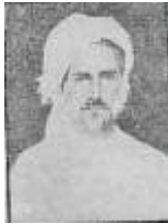
شێخ خالید نەقشەبەندی (- 1897)