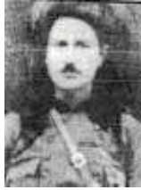
سەید حوسینی خانەقا (؟ - 1914)