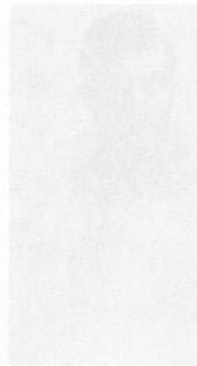
مسؤول الحلة عبدي كاظم