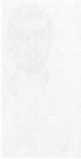
مسؤول الناصرة تامان صالح