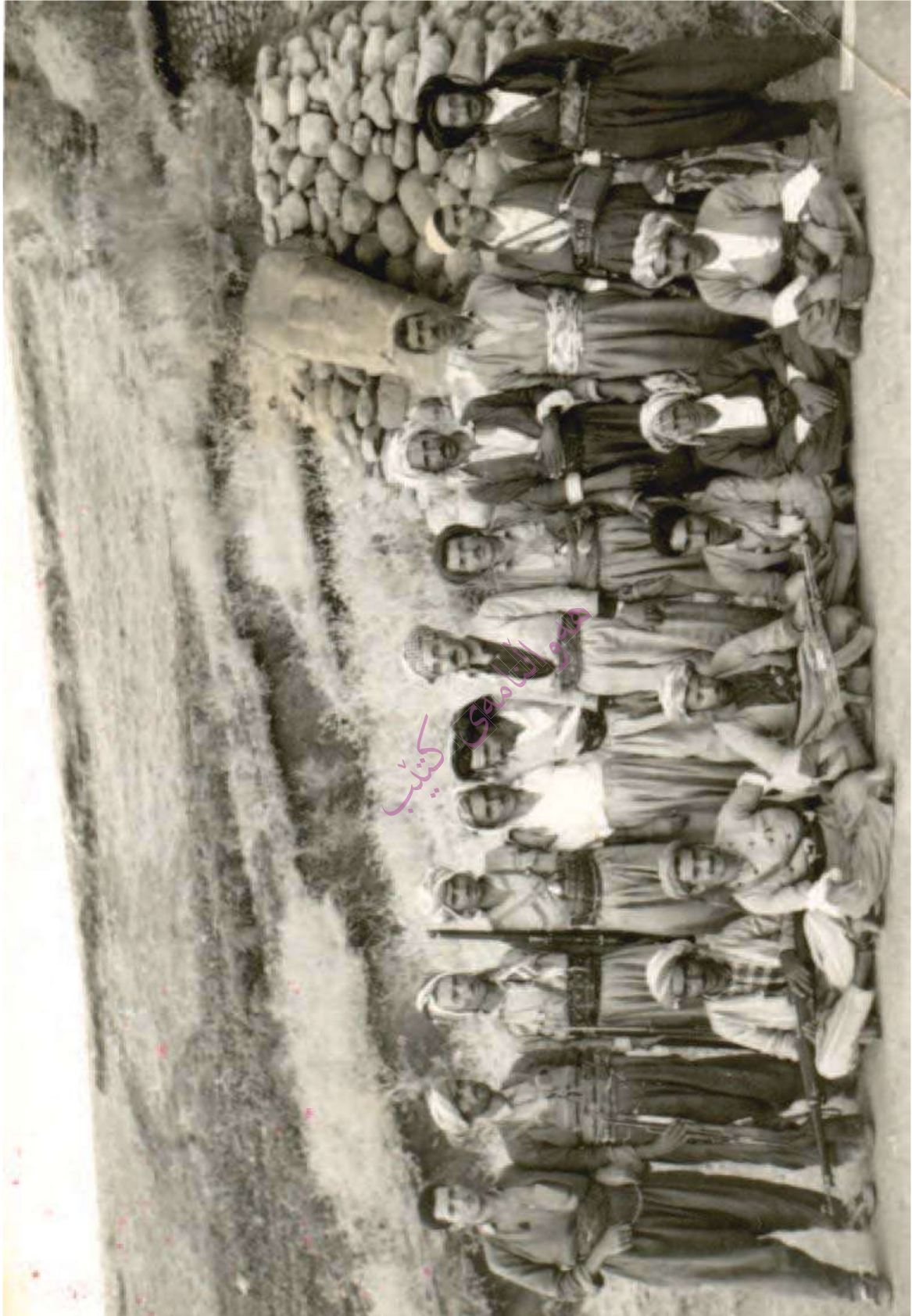
سهر پروتی قه اخی عه بدوللای موعینی یه