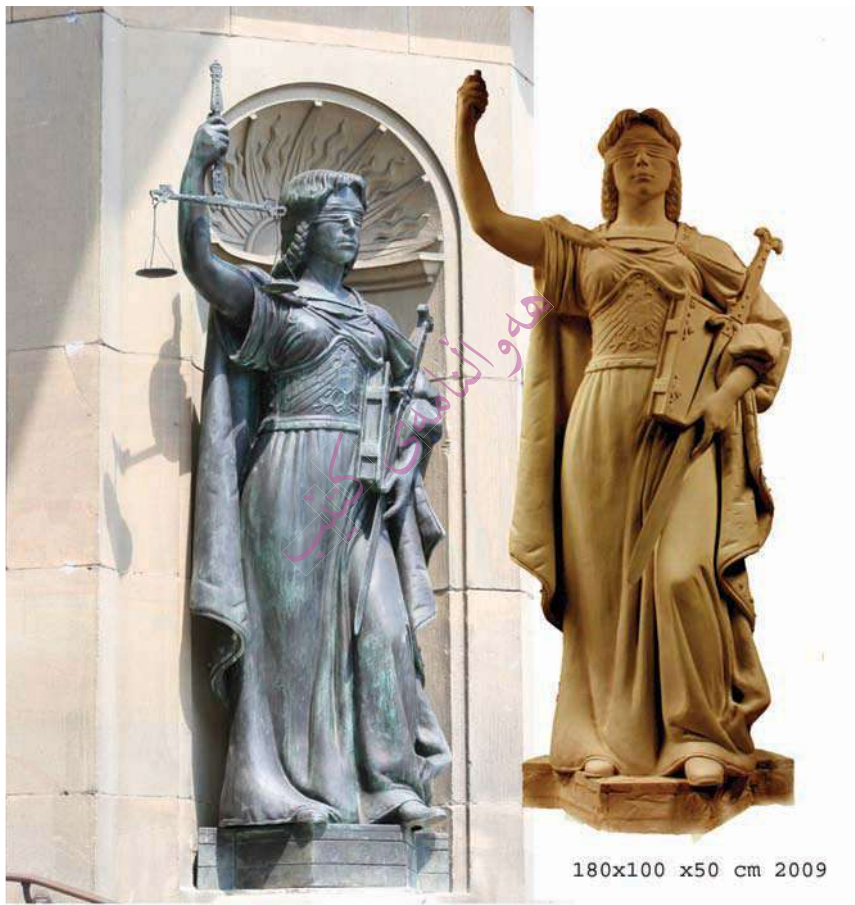
180x100 x50 cm 2009