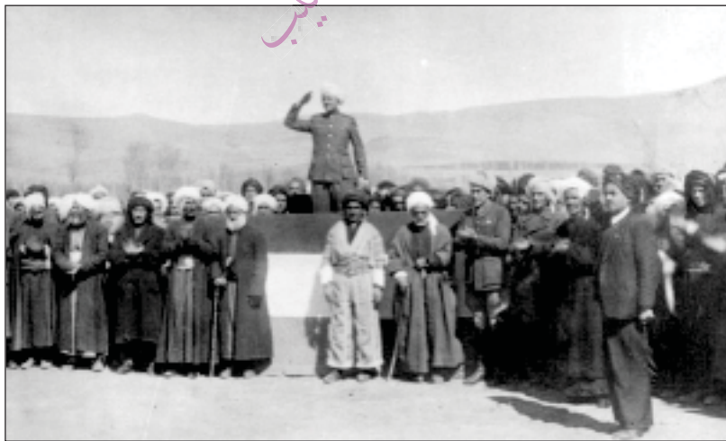
رۆژا (۲) ی پێبەندان ۱۹۴۶/۱/۲۲ فازی محەمەد سەلفا سەربازی ژ لەشکرئ پێشمەرگەیی کۆمارئ وەردەگریت

ل تشرینا دووی و لدەسپیکا کانوونا ئیککی دا، دارودەستەکتین سوؤقیەتیان د ناف خیلین کوردیدا بەرەلەف بوون لپینافی خەباتا داھاتی و سەر بەخویتی فەرمان بسەر کردەیتن وان دا ل مەھابادی کوم ببن، ئەوژی ھەموو ژبلی مامەش و مەنگۆر و دیبوکری، لدویف گازی نەھاتن، ل وی دەمی رەوشا حکومەتا ئیرانی ل جھین دی یین نازەربایجانئ ب لەرز لاواز بوو، "دیموکراتین" چەکدار کو پرانییا وان خەلکئ نازەربایجانا سوؤقیەت بوون دەست ب ھیرشکرنا سەر جەندرمە و سەربازین ئیرانی کربوو کو ب شەپرزەبی بارگەھین خو چوول دکرن د تەقین، ھەموو پارێزگەھ کەفتە ژیر کونترولا ھاڤیبوویناقە، ل وی دەمی سوپایئ سوور رئ ل ھەوارھاتنا ھیزان ژلایئ حکومەتا ناھەندیفە گرت کو بۆ بەیزکرنا بنگەھین باکوری د ھنارتن، ل دوماھیئ و ل ۱۰ کانوونا ئیککی دیموکراتان ھیرش کرە سەر سەربازگەھا تەوریزئ و نەچار کر خو بەدستفە بەردەت، ب وئ چەندیژی ھەموو دەستھەلاتا رۆھەلاتا نازەربایجانئ کەفتە ژیر دەسەلاتا "حکومەتا میلی یا نازەربایجان" ئ کو نوی دروست ببوو.