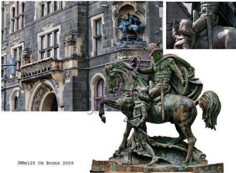
300x125 Cm Bronz 2009