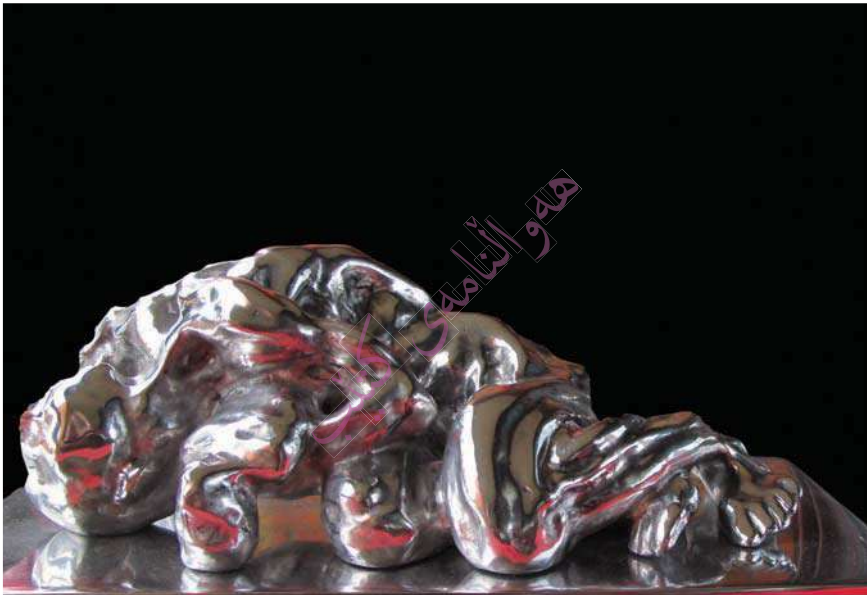
60 X30 X20 Still گدریته سٹیل