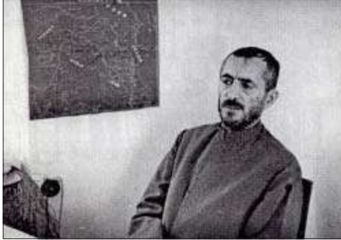
پيشه‌و قازى محمەد ل ئۇفيسا خۆ نەخشەيى كوردستانى ب ديواريفه هاتيه هەلاويستن

يى ھيمن و خودان ميشكەكى بەرفرەھ و ميانرەھو بوو، د وي دەمىدا كو جھى باسكرنىيە بلايى كىمىقە داخوازىن وي بين ميانرەھو بوون /ئۆتۆمى بۆ كوردان ل سنوورئ دولەتا ئيرانيدا/ ئەوى باوهرى ب بوچوونا گەلەك كوردان هەبوو كو دگورن كورد و فارس سەر ب ئىك مالباتا نەژاديا ئيرانىنە، ژبەر وئ چەندئ هيچ سەدەمەك نينه كو دووبارە د ئىك پىكھاتەدا كوم بىن وەكو ئەوا لسەردەمى ميديايى و فارسىن كەفن، قازى وەھا دديت كورد نەقىيىن ميديايە، مەيلا وئ چەندئ هەبوو بىژيت ناغى مەھاباد ژ ناغى "مالا ميديا" ن هاتىيە، هەروەھا نابيت ئەو چەند بيتە ئىنكار كرن كو ئەو بخۆ و لايەنگرىن وي خودان حەزەكا كوردانە يا گشتگر بوون هيقييا وان ئەو بوو مەھابادئ بکەنە مەلەندئ كولتورى يا كوردى و بزاقا نەتەويى يا كوردى، وەكو جھگرەكى بۆ سووريا و سلیمانىي كو وي دەمى مەلەند بوون، گەلەك بزاف دەاتنەكرن بو وئ چەندئ فیركرنا كوردى بگەھیتە ناستەكى ژ هەژى، لدەستپىكى پىدقى بوو ماموستا د ناغ پولىدا ب زارەكى بابەتان ژ فارسى وەرگىرنە زمانى كوردى، لى بدەمى كورت بەرى هەرفينا كۆمارئ پەرتوكىن كوردى بۆ قوتابخانىي سەرەتايى هاتبوونە چاپ كرن، هەروەھا رۆژنامەيەك و هەيقانەنامەيەكا سياسى دەردچوون، هەردووك بناغى كوردستان بوون، هەروەھا دوو گوڤارىن ئەدەبى بناغىن "هەلالە" و "ھاوار" دەردكەفتن كو تەڤايا وان بەلاقوكان ل چاپخانەيەكى دەاتنە دەرخستن كو سوپايى سۆر دابوو حزباً ديموكراتا كوردستانى، دبیت كو گرنگيدانا قازى محمەد بۆ ئەدەب و زمانى كوردى بۆ هەبوونا هەردوو هەلبەستقاران هەژار و ھيمن ڤەگەریت كو سەربارى كىمىيا هەبوونا كاغەزان هەلبەستين خۆ بەلاف دكرن.