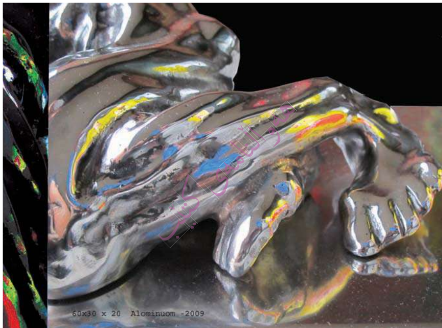
60x30 x 20 Alomnuom -2009