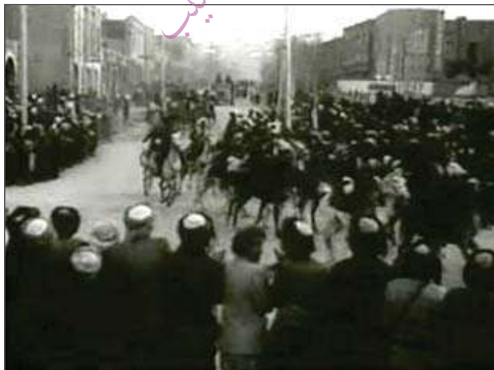
رئورەسمى ديمەنەکى ناف باژيرى مەھابادى ل دەمى کۆماريدا