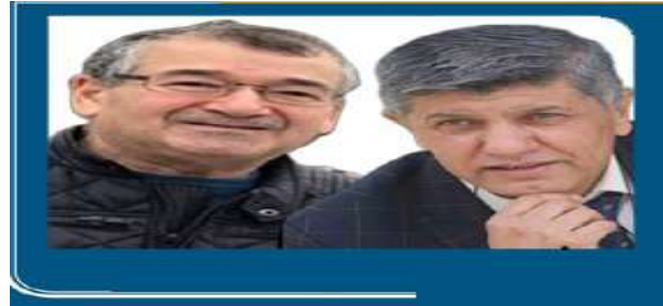
بەختیار شارەزوری و سەرکەوتی جیهاز

ئەگەر خەونی ئەردۆغان گەرانەوه بێت بۆ هەولێکی میژووویی و بیهوێ بەهۆی بۆشایی دەرکەوتنی داعشەوه و بەهاری عەرەبیهوه خەونە میژوووییەکی ئەتاتورک جی بەجی بکات، ئەوا دەبێت پشتی پەردە بخوینێنەوه، ئەردۆغان دەیهوێ لە پۆژەلاتی ناویندا کورد نەتوانی هیچ جۆلەیهک بە ئاقاری پیگەیی نیشتمانی بوونی بکات و دەیهوێت کورد نەک هەر لە تورکیا بەلکو لە هەر چوار پارچەکە، لە بۆتەیی سیاسەتی خۆیدا بتوینێتەوه (خەونی گەرانەوه بۆ عوسمانی)، ئەگەر بمانەوێ لە ریککەوتنی نیوان ئەمریکا و تورکیا تیگەین، کە هەسەدە دەیهوێت ناوچەیی ئارام بە ریککەوتنی نیوان هەسەدە و تورکیا و ئەمریکا بێت و لە پینچ کیلۆمەتر زیاتر نەبێت و ئەمریکاش دەیهوێت لە پینچ بۆ چوارە کیلۆمەتر زیاتر نەبێت و تورک دەیهوێت لە سی بۆ چل کیلۆمەتر بێت، ئەمانە تا ئیستا لە بازەنی ریککەوتنی دروستکردنی ناوچەیی ئارام دەخولیتەوه، بەلام نەهینی پشتی ئەم ریککەوتنە ئەوه نییه کە لە میدیاکانەوه باس دەرکێت، چونکە ئێمە دەزانین تورک خۆی ئەگەر چی گوشار بکات کە پیشتر بە درێژایی ۹۹ ساڵ کردوێتە هیچی پیتاکرێت، بەلکو لە دەرەوێ ئەم