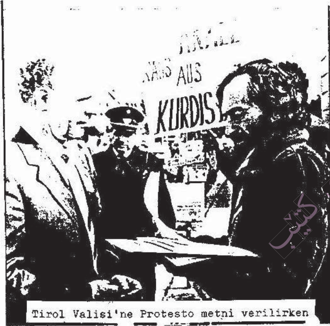
Tirol Valisi'ne Protesto metni verilirken

Sömürgeci T.C.'nin halkımıza karşı sürdürdüğü yok etme politikası gereği, Kürdistan son dönemlerde çeşitli saldırılara sahne oldu. 4 Mart'ta, Güney Kürdistanı uçaklarla bombalılarak sivil halktan yüzlerce insanı katleden faşist T.C., diğer yandan da yeni Mecburi İskan Yasası ile halkımızı sürgüne göndermek istemektedir.