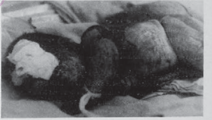
مندالی کورد له زتر بومبارانی کیمیاوی ریژیسی عیراق

سره رای چینایستی ریژیسه عیس له کوردستان . هیزه خورش- گیرهکان و گهلنی فاره مانی کورد به چوک دا نه هات و له شعر و بهر سهره - کانی دا زهبری گورچ و بریان له ریژیم دا و هیزو توانای خوبان به دوست و دوزمن نیشان دا . لهوانهش گریند تر ههنگاوی ناست بوونموه و ریک کومتی هیزه دیموکراته کانی کوردستانی خوارو له گهل تیکوشان بو پیک هینانی بهر هی به کگرتسوی کوردستانی و بهر هی بی دانی بو دامعزاندنی بهر هی یکی بهر نیسی گشت هیزه دیموکراتی شورشگرهکا- نی عیراق ، بوو به هوئی هیوا دلخو- شی و پشتگیری کومه لانی خلیجی کورد له کوردستان و له دهره وی و لات .