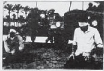
ٺازا دیتخوازان له بهر دستي داگير گهران!

راپهريني هيمنانهي نم دوايي - سانهي خه لکي تيرکوشهري فله ستن ، سرنجي کور و کومله سياسيگان و بيروري گشتي جه پانسي بو لاي خوي راکيشاوه ، خه لکي داگيرگراوي فله - ستن که 40 ساله ، کهوتونه ٺير - دهستي حکومتي شيرائيل و بيرون به فورياسي کهين و بهيني حکومتيه کونه بهرنيته کاني عهريسي ، لهباريکي غهزه و له ناوچه داگيرگراوه کاني تري فله ستن ، راپهرينيگي هيمنانهي گشتي يان دهست بيگيرد و شهيم راپهرين و مانگرين و دوکان و بازار داخستنه بهشي داگيرگراوي شاري بهيتوالمقدس و همو نارچه کالسي داگير گراوي گرتوه . داگير گهراني جووله که لسه سه رتاوه و ستنان به گولله و لسه کوشتر شيرادهي خه لک تيرک بشکيتن و راپهريني بهر بلگوي خه لک سرکوت بکن ، سه رته راي کوشتنی دهيان کسي و بهرني دار کردني سدان کسي بزوتونه ي گهلي فله ستن بهر دوام بو ، لوانسي کير و کوري فله ستن ، فوتابي و خوتندکار و کاسکار و زن و بيوا ، رٺانه سر شه قامگان و لسه گولله و کاري نه سرين رير و په لاماري درنده ي بهريزاني شيرائيل بهرنيگانه و له شه قامگان دهستان کرد به ناگر تن بهرداسي تايدي لوتوميلان و به خريکه بهرد و مستي بو لايين بهر بهر دهگانيان درٺوه پيدا بو لاپهري 7