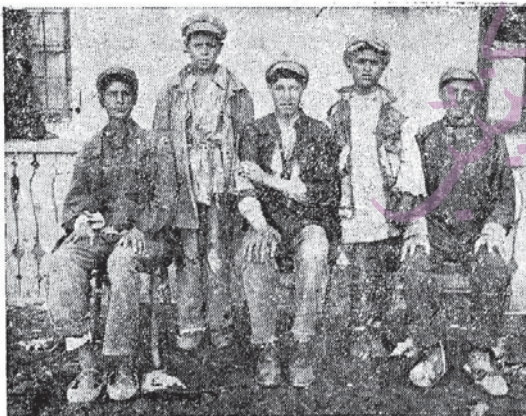
Şagьrtə tьzə jək sь gynda hatьnə teknikume