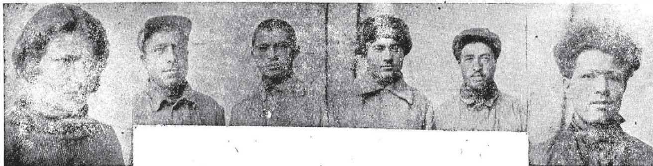
Dərbdare texnikuma kyrmança

Nəha zə mə te xyəstən, wəkl əm dəha həşjar u cəv vəkəri bən dərheqə peşdəbərna kultura kyrmança, 1) məktəbe kyrmança u texnikum sərbəst kən bə kadre həzər, 2) Məktəb sərbəst kən bə ktebe himli u baş. 3) zə həmu zarave kyrmança həzər bəkyn zymane nəvisari bona həmu kyrmançe xəvatcl Zakavkaze. Veda