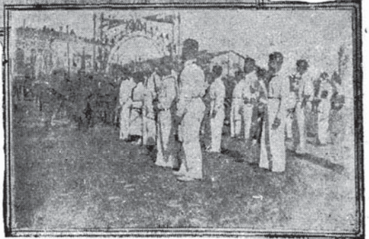
Məjdənədə sər tribunə Wəklə hıqməte Parade qəbul dıkır.