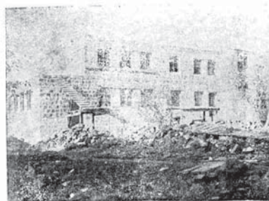
Avəje təxnəkəna kymança təzə əb pərə

şən ty əmər u əjlənkə wən bə hərə əlljə tynənyən wə gəna hən dənə rəst bə Əwənə sərə cəjdə bə əmərə kəwəwənljə nəv bəjəntijədə dənə, u ty lək bənə wən