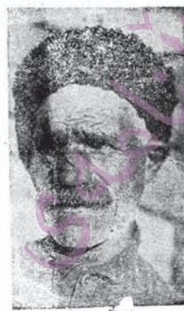
Kolxozvan hav. Şıro