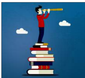
سیناریۆ نایندەبێه‌کان 115-114...