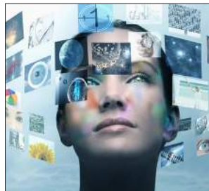
نایندەناسی، پیشبینی و بەڕنامەریزی؛ نیکچوون و جیاوازییەکان 27-10..