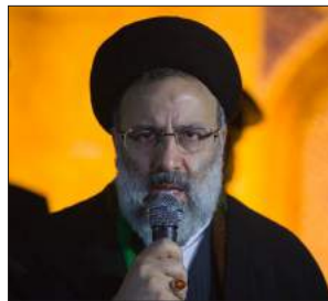
سەردەمی رەئیسە و نایندە رۆژەلاتی کوردستان 61-52...