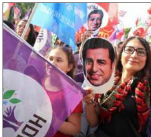
گرمو له سه‌ر کوردانی دئشکاو گنجی کورد له تەرازوی هەبژاردنی 51-37... ۲۰۲۲-ی تورکیادا