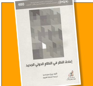
دوو بارە بێرگەردنەوه له شیرازە نۆتی جیهانی 111-106...