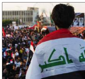
وانه ئەفغانستانی بێه‌کان له عێراق؛ ئەگەرەکانی پاش رۆگۆڕین یان کشانەوهی هێزەکانی ئەمەریکا 103-96...