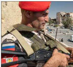
بەرزەبەردنی رۆسیایانە قەیرانی سووریا و کاریگەری ئەسەر رۆژئاوای 79-62... کوردستان