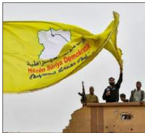
ئانگارییەکانی بەردەم بایدن؛ ئۆتۆنۆمی کوردی و فراوانخوازی 93-82... تورکی