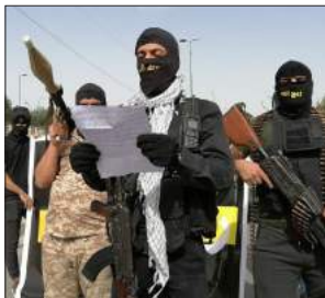
عێراق و هەرێم له ئەگەری ئەمرگۆڕینی سوپای ئەمەریکادا 36-28...