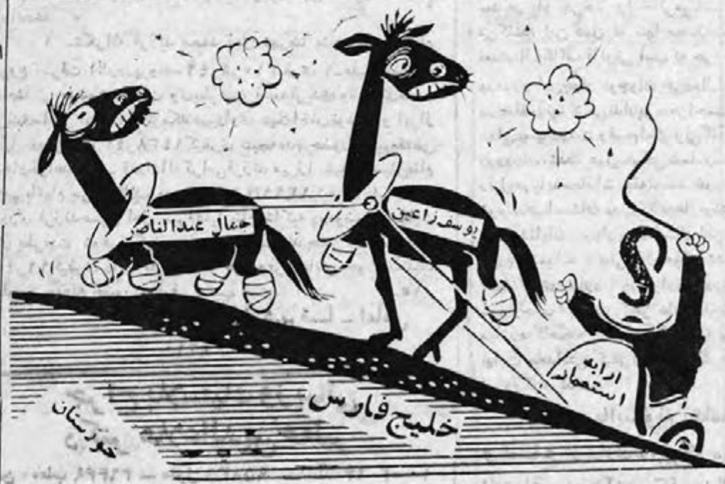
اسبهای بارکش استعمار...

نیست که بتواند بحمل کالاهای صادراتی و وارداتی ایران مبادرت نماید. ماهواره در خلیج فارس با خشن‌ترین و بی انصافانه‌ترین نحوه رفتار کمپانیهای بزرگ غربی و شرکت‌های حمل و نقل دریائی دست بگریبان بوده و