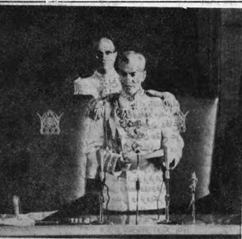
شاهنشاه آریامهر صبح دیروز اجلاس هیئت را افتتاح فرمودند

نخست خاک بود خاک خون گشت و خون بر خاک نام داشت. نام، خرد خاک و خون بود هم بر خاک و خون بود و هست. آناتکه در نام پیوستگی یکی بودن خاک و خون را در نیاند. آن زمان بیدار شوند که خونهای بر خاک ریخته بازی نظر روزگار کرده و آموزش آئین پاس خاک و خوشنشان گردید.