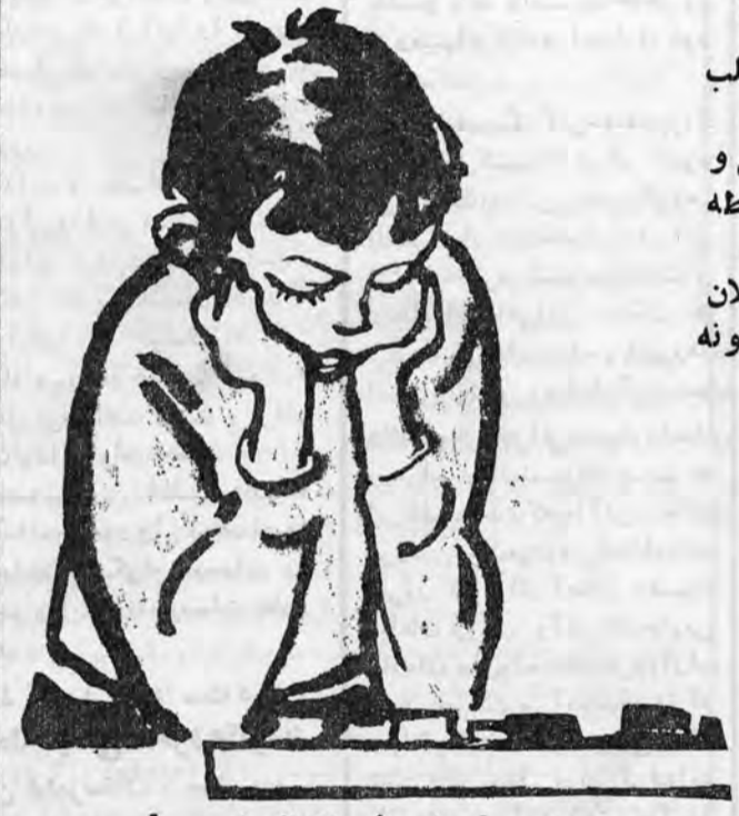
در اندیشه فردا - فردای نامعلوم...!