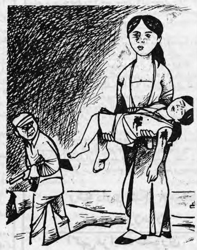
سر نوشت کنونی هم نژادان ما در عراق

بخاطر دیداری از وسائل مجهز و وسیع باند سازنده هر و این بود که اخیراً از طرف شهر بانی کشف و افراد آن دستگیر گردیده‌اند. گذشته از وسائل مزبور و طرز کار با آن وسائل برای تهیه