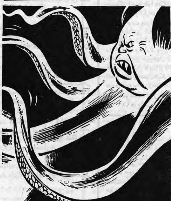
هیولای چین سرخ - خطری که همسایگان از آن شافل اند

این عنصر خود سر و متجاوز بحقوق ملت ایران را از ایران بیرون کنید!