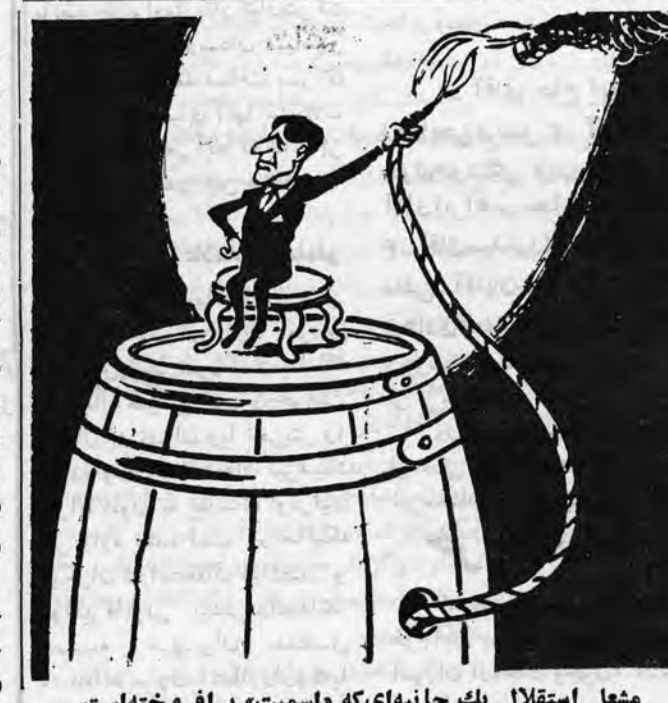
مشعل استقلال يك جانبه ای که «اسمیت» بر افر وخته است