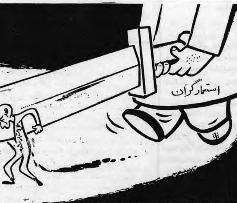
سه‌ممل استعمار شده و ملل استعمارگر در حکومت واحد جهانی