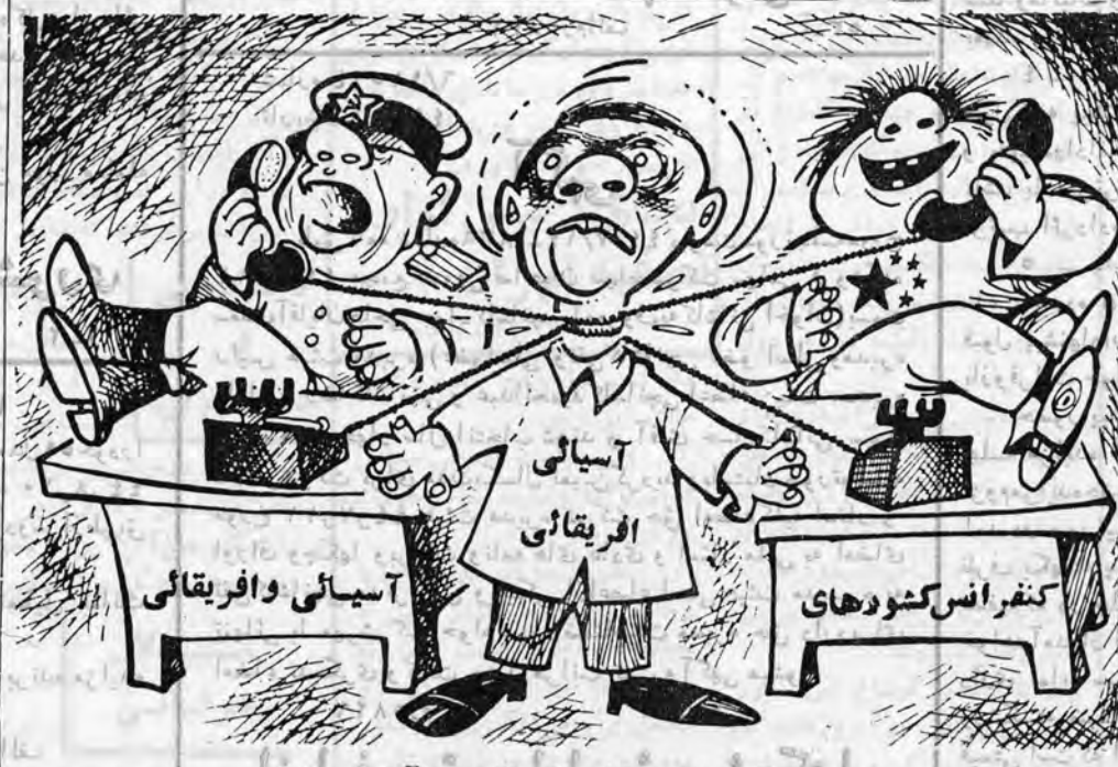
آنچه به روزگار باندونک دوم آمد

برای توسعه امر کشتیرانی صورت میگیرد - بدین کیفیت که با حمایت وزارت اقتصاد و سرمایه‌گذاری سرمایه‌داران ایرانی یک خط کشتیرانی برای ساحل خلیج فارس تاسیس خواهد شد که نیازمندیهای حمل کالاهار از این قسمت از خلیج تامین نماید. اکنون مدتی است در این باره از مقامات مسئول و برخی از سازمانهای علمی و خصوصی سخن بنیان