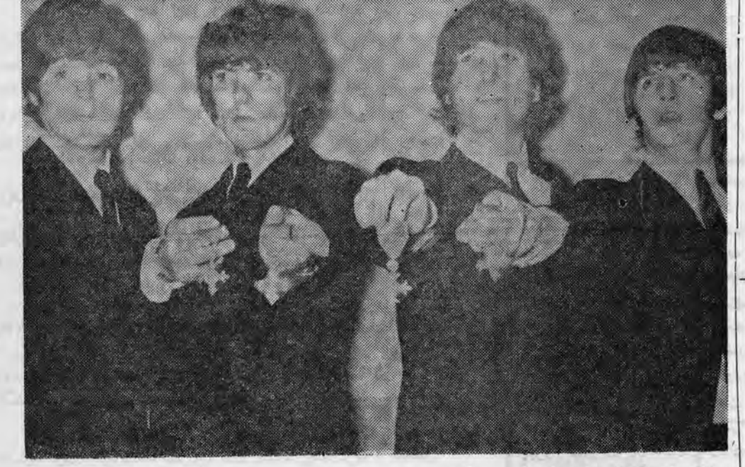
دارندگان نشان امپراتوری ...

تذکار یه دانشگاه ملی و تذکار یه دانشجویان روز پنجمشنبه در روزنامه‌های تهران، تذکارهای از طرف اداره روابط عمومی و انتشارات دانشگاه ملی درج شده بود. این تذکار یه ظاهر در جواب یکی از نمایندگان مجلس شورای ملی انتشار یافته بود. مسئله بسیار حائز اهمیت همین جاست که یکی از نمایندگان مجلس شورای ملی در جلسه رسمی مجلس سؤال خود را تقدیم ریاست مجلس مینماید و در خواست می‌کند که وزیر آموزش و پرورش در مجلس حاضر شود و باین سؤال پاسخ بقیه در صفحه ۴