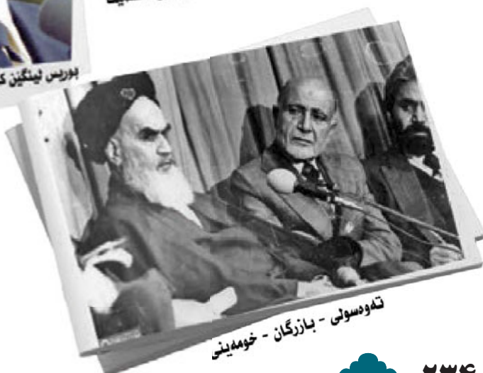
ته‌وسولی - بازارگان - خومه‌ینی