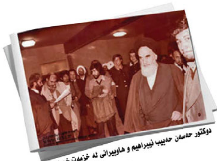
دوکتور حسن حدیبی نبیراهیم و هاویریانی له خدمت خومهینی دا