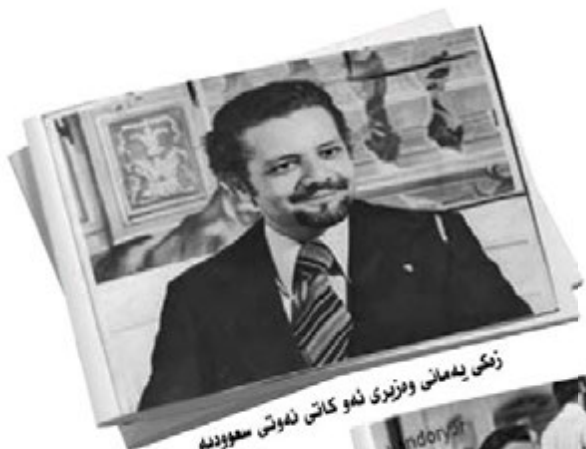
زنگی یه‌مانی و وزیر ی نه‌و کاتی نه‌وتی سه‌وودیه