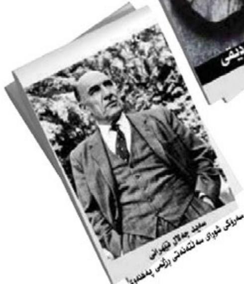
دواین سه‌زوک شوی سه‌ ئه‌که‌که‌کانی ئه‌ن سه‌ په‌که‌وه‌وه سه‌ئید جه‌ لاله‌ ئه‌که‌وه‌وه