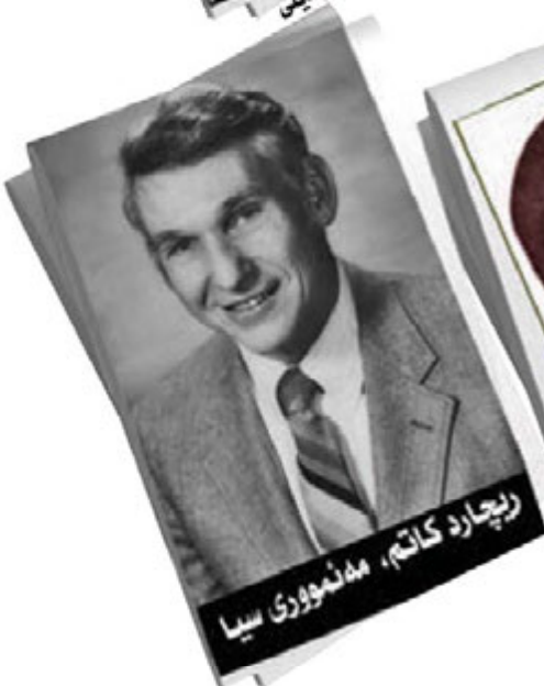
ریچارد کاتم، مدهموری سیا