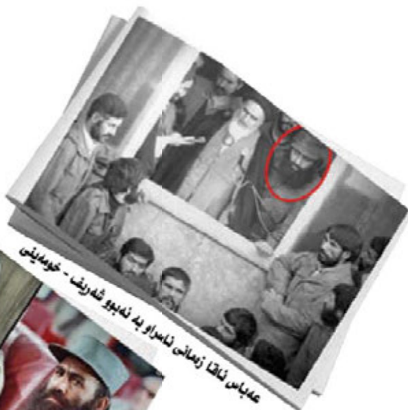
ع‌دباس‌ ن‌اق‌ا ز‌عم‌انی ن‌اس‌راو به ن‌د‌ی‌وو ش‌د‌ری‌ف - خ‌وم‌د‌ینی