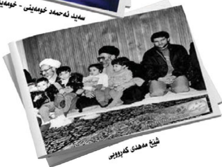
شیخ مه‌هدی که‌روویی