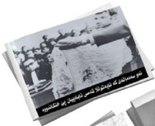
له‌و سه‌ده‌مانه‌ی که ئه‌مه‌وانه‌کان شامس ئه‌به‌تیمان ئه‌ن عه‌که‌که‌وه