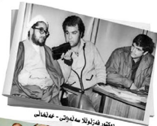
دوکتور فدرلونا سته‌واتی - خه نخالی