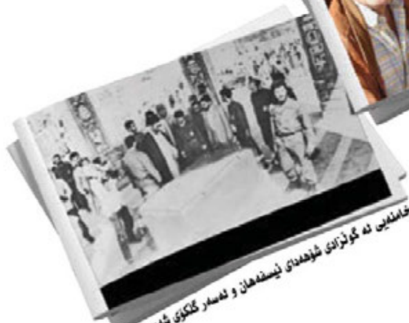
خامنه‌یین نه گونزانی شوهده‌دای نیسفه‌هان و نه‌سار گنکوی شه‌س نابندی