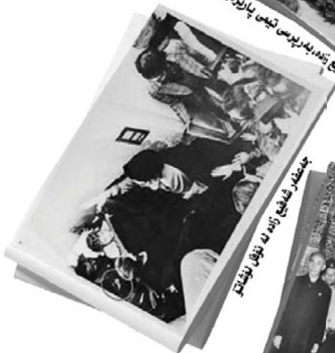
جده‌عقەر شه‌فیع زاده له نۆقل بوختاو