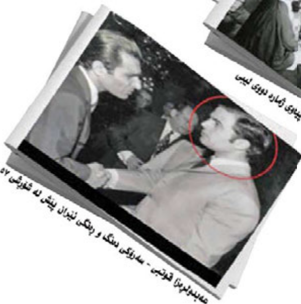
ع‌د‌ی‌ن‌س‌ر‌ن‌ا ق‌وت‌س - س‌را‌و‌کی د‌نگ و د‌نگ‌س ن‌ی‌وان پ‌ن‌ش له ش‌ور‌ش ۵۷