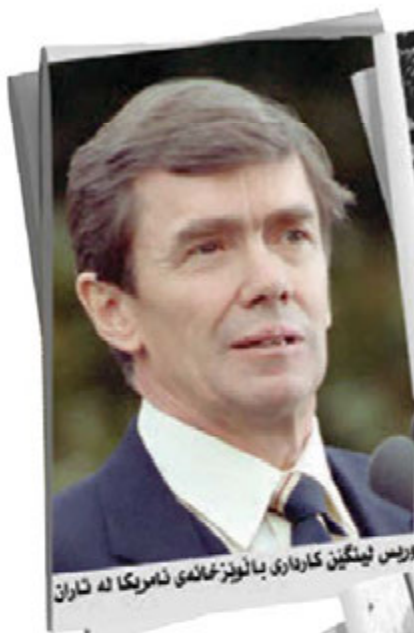
بورس نیئنگین کاره‌اری بانوئیز‌عالمی نامریکا له تاران