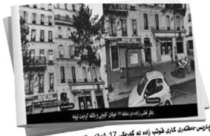
بۆر ئه‌ب زاده، نووسه‌ ١٧ مه‌مان گه‌ی و دانسه‌ گۆرۆن لوه