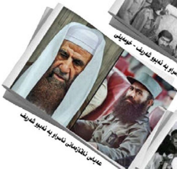
ع‌دباس‌ ن‌اق‌ا ز‌عم‌انی ن‌اس‌راو به ن‌د‌ی‌وو ش‌د‌ری‌ف