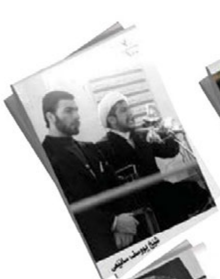
شیخ ابوبکر سائینی