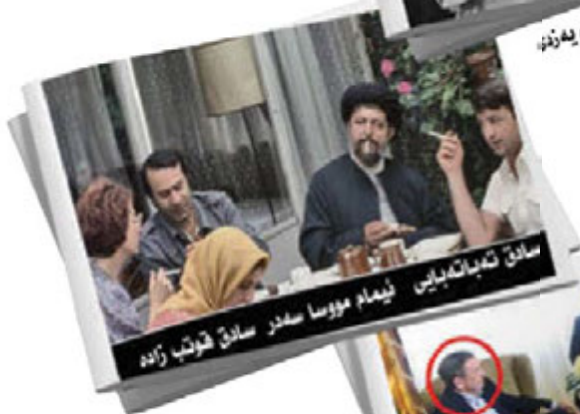
سابق نه‌بان‌کله‌بایی ئیمام مه‌وسا سهدر سابق شه‌وتب زاده