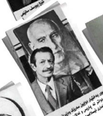
شاپور به‌غینار، نوازین سارنگ و وزیرانی شا که نواز ته پارس و نه‌لایان و رگی کومارده نیساریمیدوه تیرور گرا