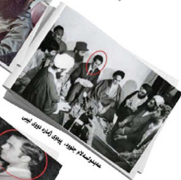
ع‌د‌ی‌ن‌سه‌ لام ج‌ل‌ود، پ‌ی‌و‌ی ز‌ماره د‌و‌ی ل‌ی‌س