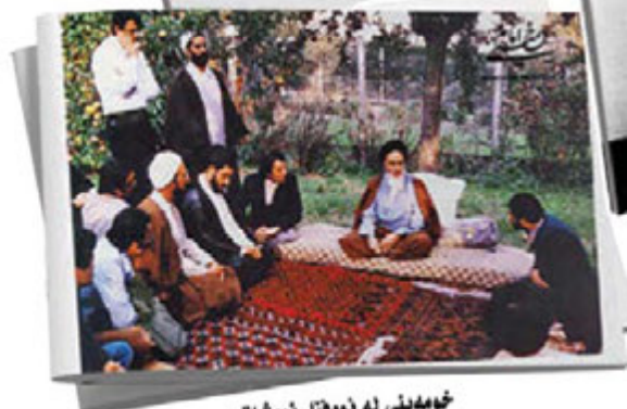
خومدینی له نووئیل نووشاتو