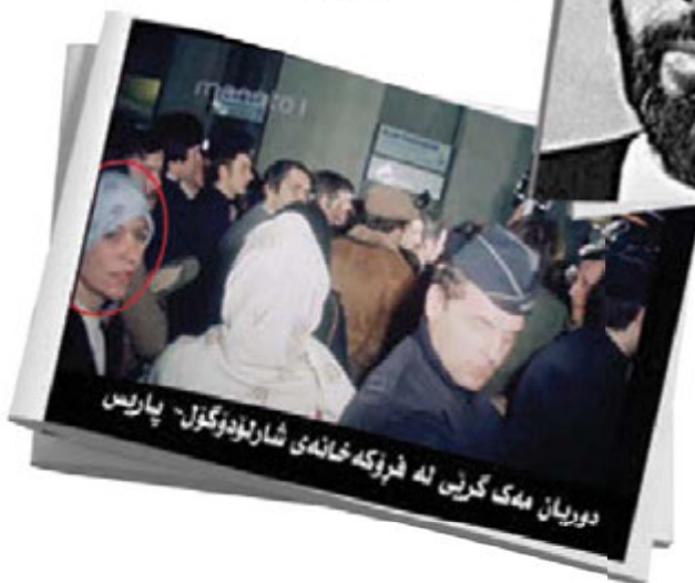
دوربان مه‌که‌ گه‌رنی له‌ شه‌رۆکه‌خانه‌ی شارلۆدوگۆل - پارێس