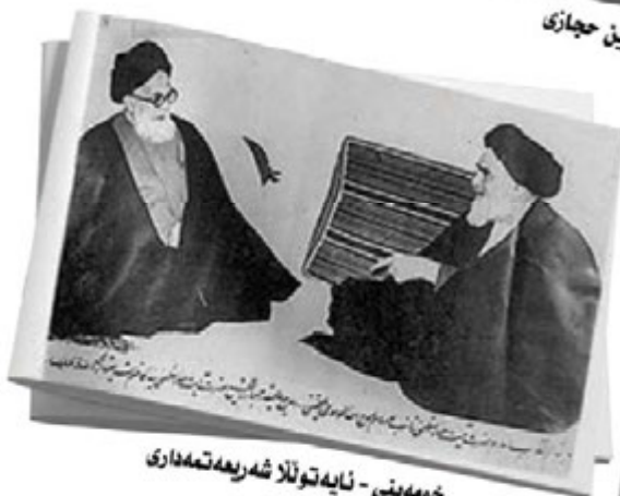
خومه‌ینی - نایه‌توللا شه‌ریعه‌تعه‌داری