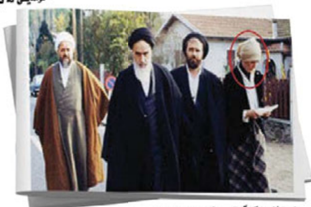
دوریان مهکا گری - نه حمهد خومدینی - خومدینی - شه هاب نیشراقی