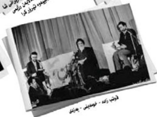
قوتب زاده - لومینانی - به‌زندی