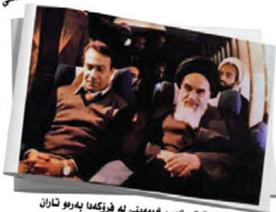
سائق قوتب زاده و انومه‌ینس له فرۆکه‌دا به‌رهو تاران