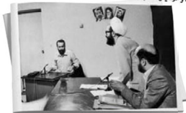
سائق قوتب زاده له‌کاتی دادگایی کردن و سه پاندهنی سزای سیناردها