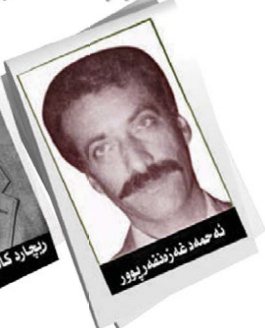
نه حمهد غه زندهه ریوور