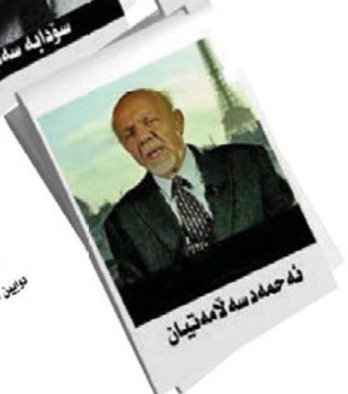
ئه‌ جه‌مه‌د سه‌ لاله‌ ئه‌تیمان