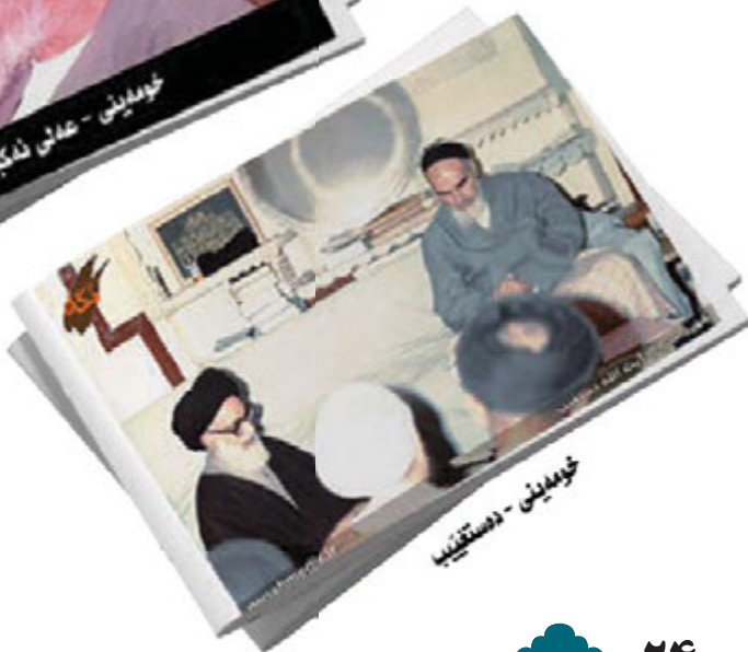
خوبینین - دستگیر