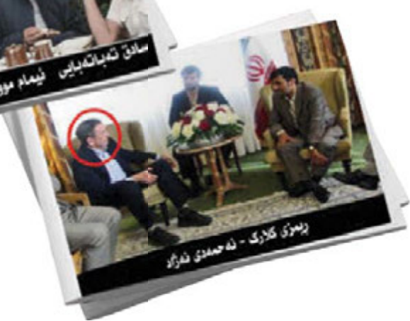
ریه‌زی کلارک - نه‌حمیدی نه‌زاد