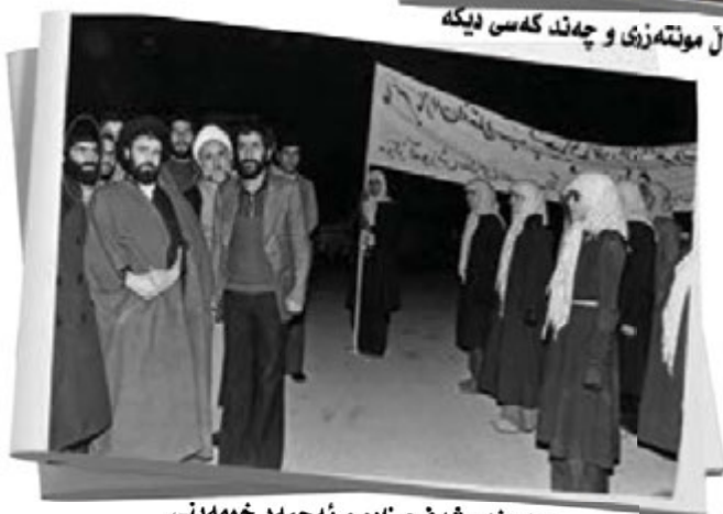
جه‌عقهر شه‌فیع زاده و نه‌حمەد خومه‌ینی له پایگاهیه‌کی سه‌ربازی له ئیران