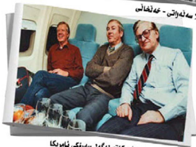
ریچارد کاتم له‌گه‌ل سه‌روکی ناسریکا