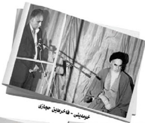
خومه‌ینی - فاخره‌دین حجازی