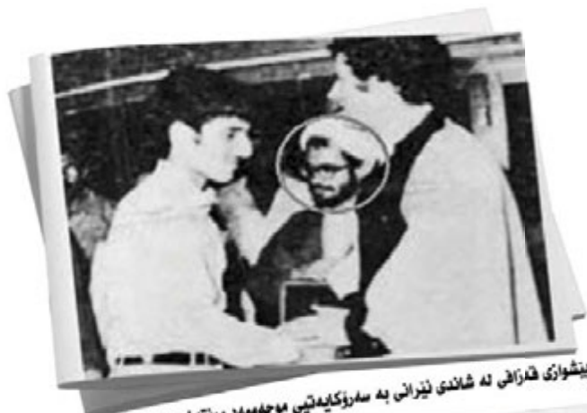
پیشوازی شەرزانی لە شاندى ئێرانى بە سەرۆک‌کابینه‌تیی موحەممەد مونتەزەزى لە ساڵى ١٣٥٨