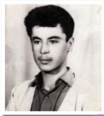
١٩٦٥ قه لادزی