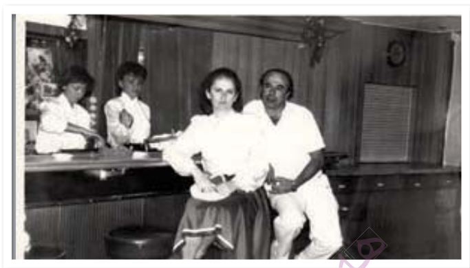
له گهڻ نیکای هوسهرم ته مموزی ۱۹۸۷