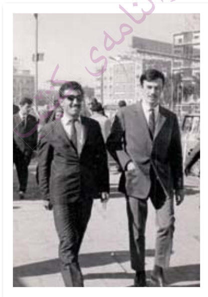
١٩٧٠، ٤، ٢، ره فیق، قادر حاجی عه بدوئلا، به غدا