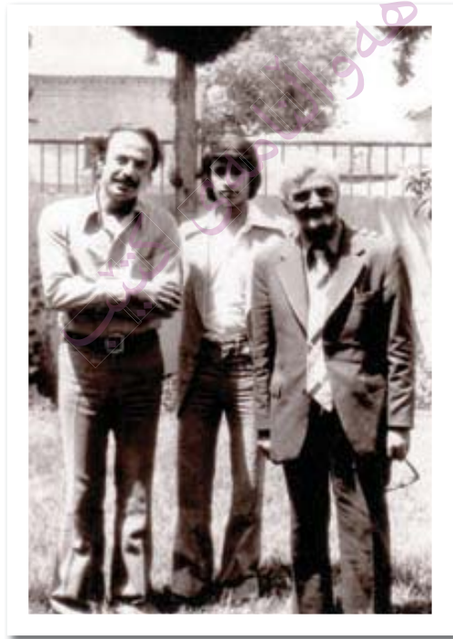
ہیمن - thumbnail - رهفیق ۱۹۷۸