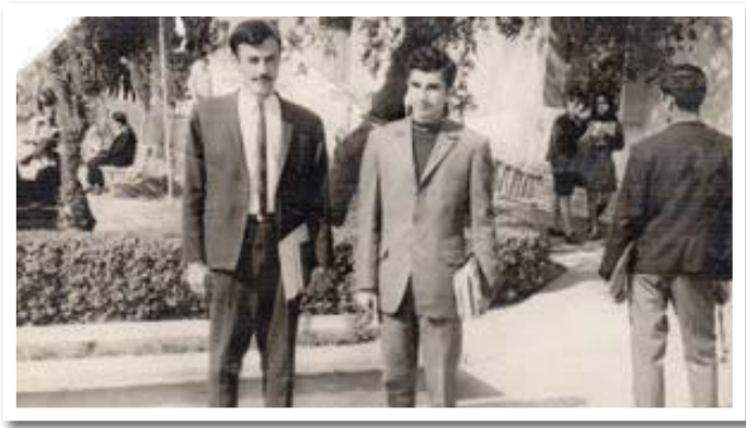
رهفیق، کهمال میراودہلی ۱۹۷۱