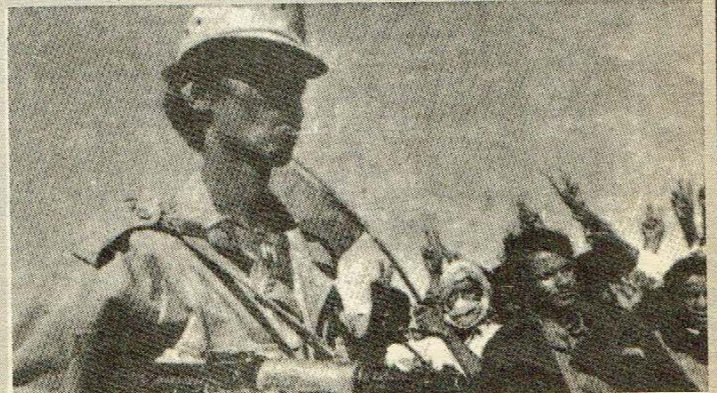
مناطق البوليزاريو : انتصارات جديدة

بعد تطوير علاقاتها مع المحور السعودي - العراقي قامت السلطة في اليمن الشمالي بتمهيد داخلي للأرض من اجل ازاحة معوقات النخاتها بهذا المحور الرجعي . وقد دفعت السلطة فجر يوم التاسع من