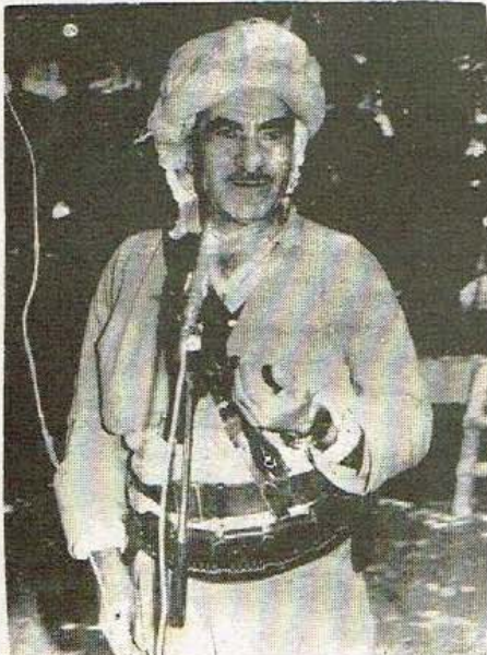
الناضل مصطفى البارزاني

سأت حال الحزب الديمقراطي الكردي في لبنان "المباركي"