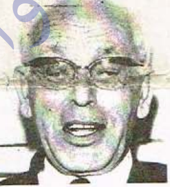
فخامة الرئيس فرنجية

رفع الحزب الديمقراطي الكردي في لبنان الى رئيس الجمهورية الكتاب المفتوح التالي نصه : نرجو من الله سبحانه وتعالى ان تكونوا في اتم الصحة والعافية .