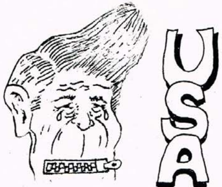
گوډاري ته کتوليت شي پوليتيکن (ي سوسپال - ديموکراتي سويد، ژ ۱۹، ۹۸۶، نوسويو به تي :-

يو سولماندنې شو راستيې که مروغه دوور ولا تکان له نازارو ژاني ميلله ته که چا ندانده دژين و خو به خاوهني کيشه که دوزان، نزيکه (۶۰) که سي دانېشتوي شاري ژوپاله ههستان به روشتنيکي نارېزاييانه دژي بومبارانه درنده که ي فروکه کاني رژيمي نه زاده پرستي تورک، روپوشته که له لايېن کومله ي کلنوري کوردوستا نيوه - ژوپساله - سرپرستي کراو ريکخرا له کاتريري ۳۰، ۱۱ ريکه وتي (۸۶/۸/۲۳-۲۴) له سهنتري ژوپساله وه دستي پي کرد بهرو، ستوکپولم، لوم شست که سه ۱۱ که سيان ثافره ت بوون، ۲۲ سعاتي خاياند، به لام شم روشتنه له لايېن ده سگاي راگه پندونه پشت گوي خرا له ستوکپولميش دريژه درا به روشتنه که و ژماره يکي زوري کورده کاني ستوکپولميش به شاريان کرد، خو پيشانده که چوه بهردهم هر دوو بالوي زخاني رژيمه نه زاده پرستکاني تورکيا و عيراق،