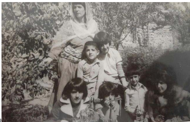
وسره ت و منداله کانم نه سرین، بهختیار، ژاله، په خشان، مه جید و گولاله