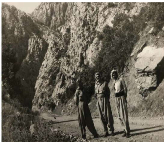
وینهی سهیرانیک له بهرزاییه کانی نهوسو که له بیره وه ریبه کانمدا له سهری نووسیمه له گهل هاورنیاں جه لال به گی نه حمه دی و عه بدوللا نه علبه ندی