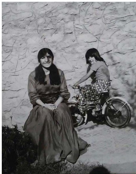
کچی گه ورهم مه هاباد و گولاله