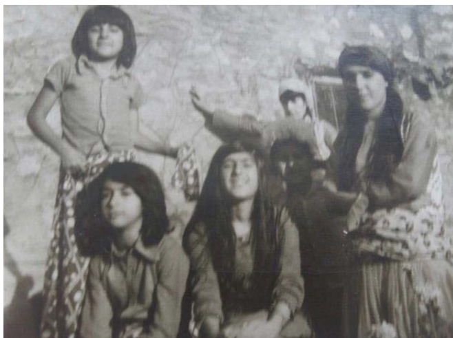
کچه کانم نه سرین، گه لویژ، په خشان، گولاله، بهختیاری کورم و نوسره ت له ریزی پشته وه