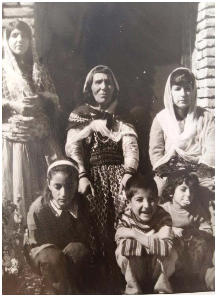
دایکم، نوسرهت و نهسرینی کچم، ریزی پیشه‌وه ژاله، مه‌جید و شیرینی برازام