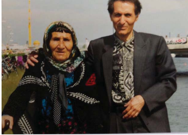
دایکم تهلیعه ئەحمەدی و خۆم. ئەم وینەیه له سوید گیراوه، ئەو کاتە ی دایکم بو سەردانمان هات و ئیتر دوایین دیدارمان بوو