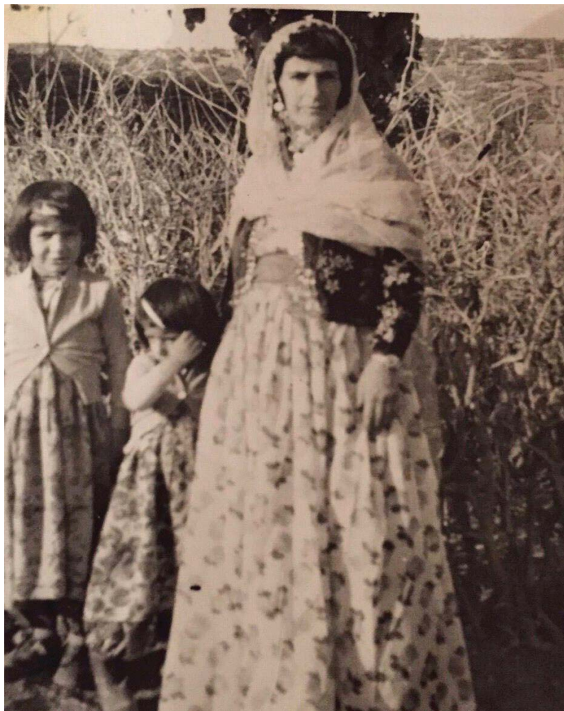
نوسرهت و مندالّه کانم مه‌ه‌باباد و گه‌لاوینژ