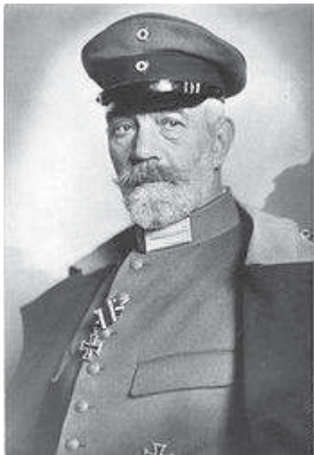
راویژکار بیتمان ھولفیک (1909-1917)