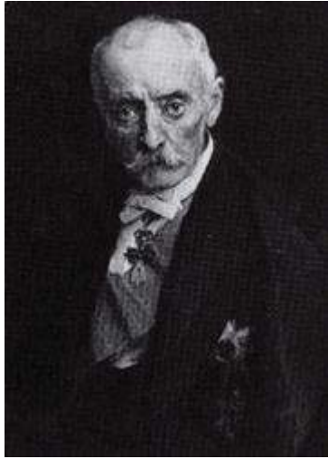
راویژکار ھۆنلوهه (1894-1900)