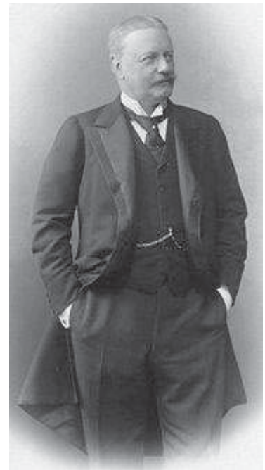
راویژکار فون بیلوڤ (1900-1909)

* نهم وینانه ھه موویان له سایتی www.wikipedia.com وەرگیراون